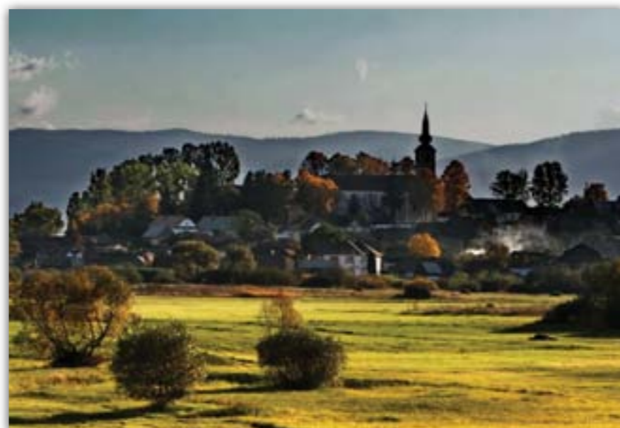
Danis János: Őszi reggel Remetén

A városunkban működő fotóklub harmadszor hirdeti meg Batorbágyi fotópályázatát. A nemzetközi versenyen részt vehet bárki. Amatőr és hivatásos fotósok számára egyaránt lehetőséget ad arra, hogy akár kötetlen témájú képpel nevezzenek, vagy a Batorbágyi kategóriában – ahogy a pályázati kiírás fogalmaz – „Alkotásaik mutassák be a város gazdag épített örökségét, történelmi helyeit, a batorbágyiak mindennapjait és ünnepeit, az itt élők és az ide dolgozni járók napi munkáját, a gyönyörű természeti környezetet, a várost övező tájakat és a hely minden vonzerejét. Képeikkel villantsák fel a még fellelhető hagyományokat. Mutassák be a képeken, milyenek látják Batorbágyot, örökítsék meg testvérvárosaikkal szövődött kapcsolataikat, az ott élők életét. Fotózzák le a Batorbágyról elszármazott híres embereket, vagy batorbágyiak a világ más pontján való cselekedetéről szóljanak, esetleg átvitt értelemben fogalmazzák meg Batorbágyot.”