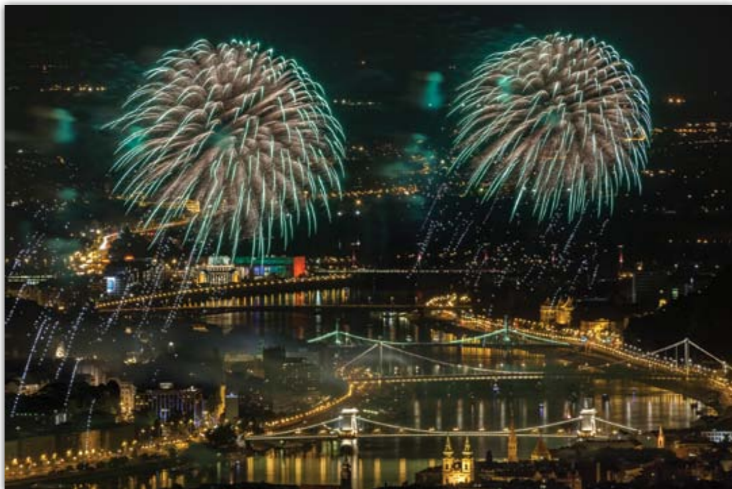
Imre Levente: Medúzák