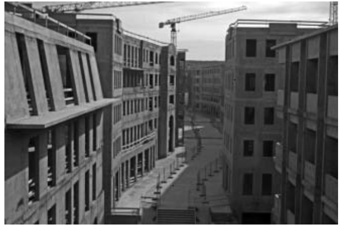
A TóPARK Párizsi utcája

A TóPARK összesen 180 hektáron valósul meg az „Aranyháromszög” néven is emlegetett területen, amelyet három kulcsfontosságú autópálya (M0-M1-M7), és az elővárosi