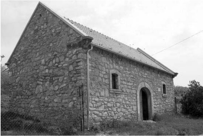
A Kunyik-pince kész homlokzata az Űrge-hegyen

Elkészült a Kunyik pince tetőszerkezetének és külső homlokzatának felújítása, amelyet az önkormányzat intézmény-felújítási program keretében valósított meg 8.8 millió forintból. A felújítást követően a préház az Űrgehegy egyik figyelemre méltó épületévé vált.