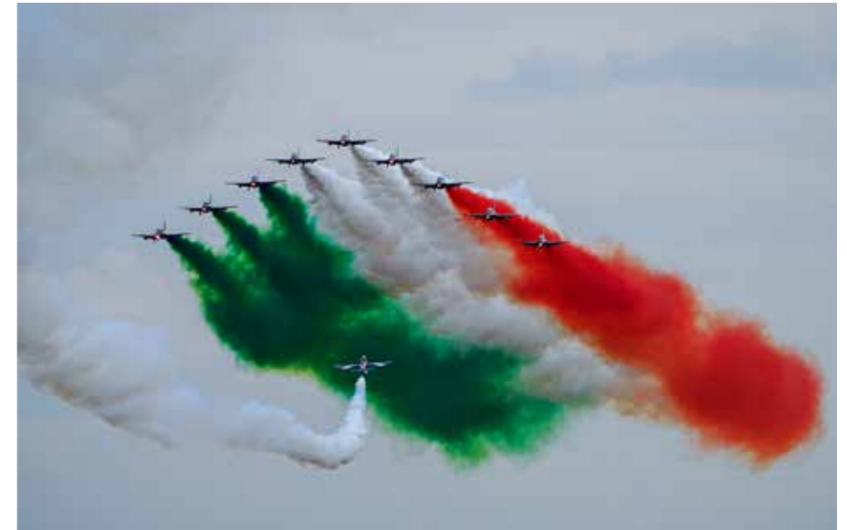
Sandra Zagolin: Tricolor arrows

A beérkezett fotók száma és minősége minden várakozásunkat felülmúlta. A zsűri a pontozás után online értekezleten osztotta meg a gondolatait, ahol egyebek mellett egyöntetűen méltatták és folytatásra méltónak ítélték a klubok versenyét. A fotográfia trendjeit figyelembe véve kifejtették, a legfontosabb