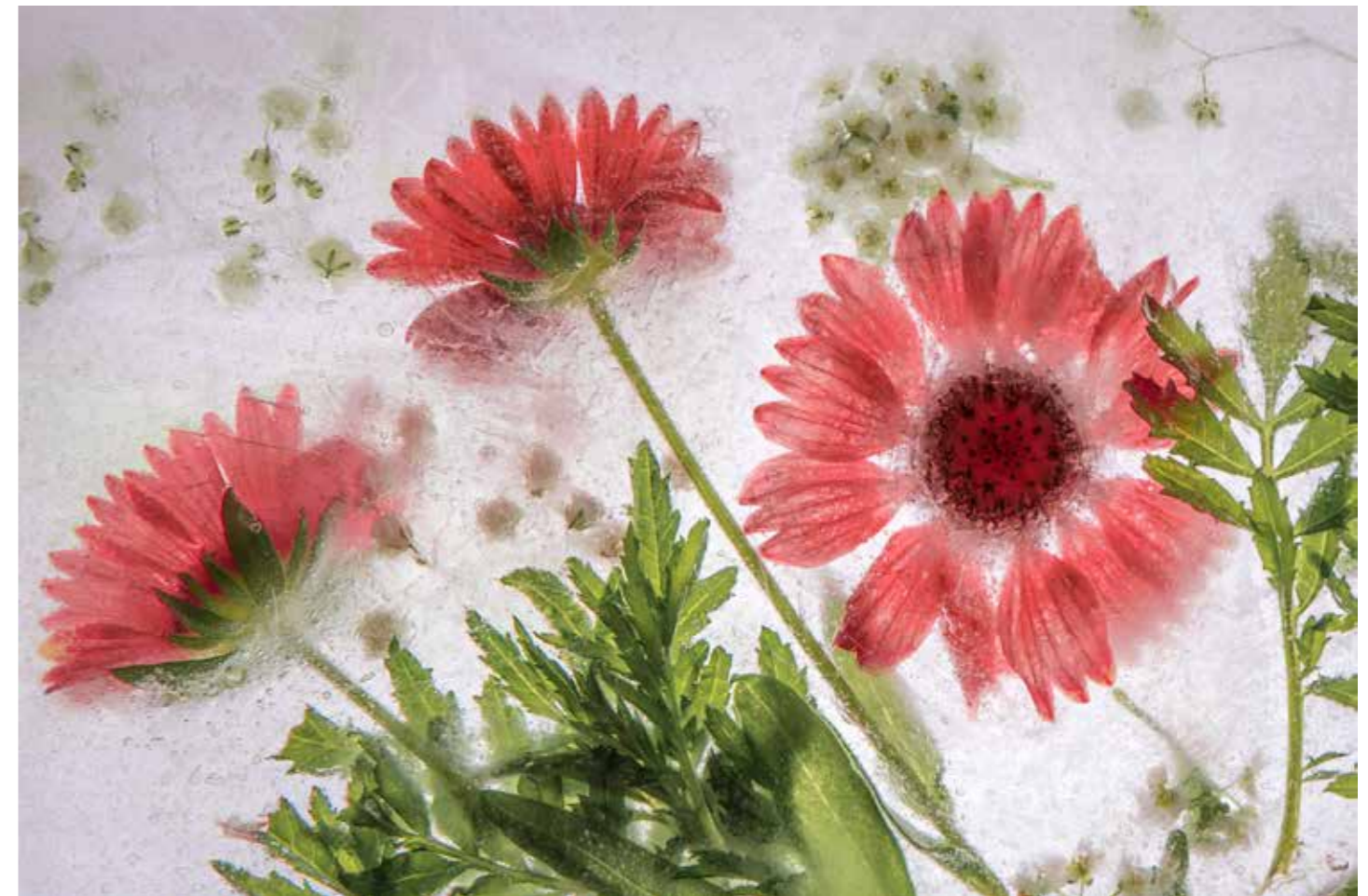
Csörögi Dóra: Nemzetünk, avagy Trianon 100. Az elmúlt fél év eseményei és változásai ihlették a Karanténvir(l)águnk című fotósorozatot, amelynek egyik eleme a képen látható.