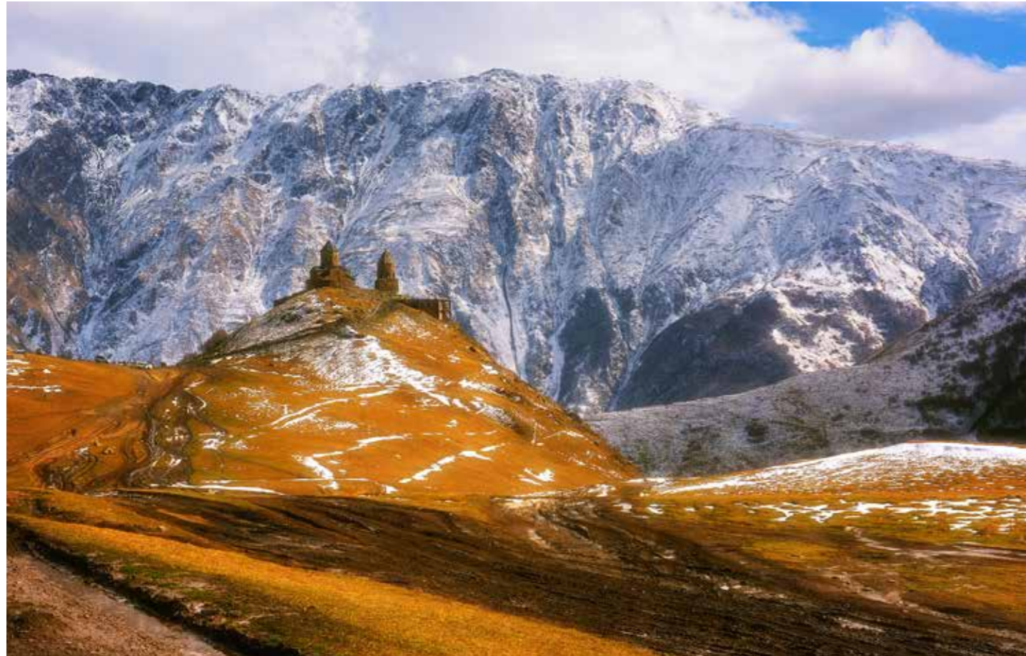
Zelkó Csilla Gergeti templom a Kaukázusban című fotója október közepén készült Grúziában, a Kaukázusban. A több mint hétszáz éves gergeti Szentháromság-templom kétezer-százhetven méter magasra épült, ötezer méter feletti csúcsok veszik körül. Eljutni a templomdombig mintegy félórás rázkódás útalan utakon. A sárba vésődött keréknyomok remekül vezetik a szemet az ősi templom irányába. Varázslatos látvány volt az épület magasságáig tartó meleg őszi színek pompája, amelyet a fenséges Kaukázus hófödte csúcsai öveztek.

Felkészítés eredményes felvételre, az egyéni képességek fejlesztésével.