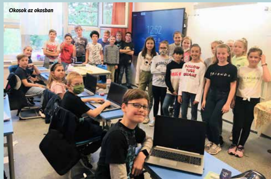
Okosok az okosban