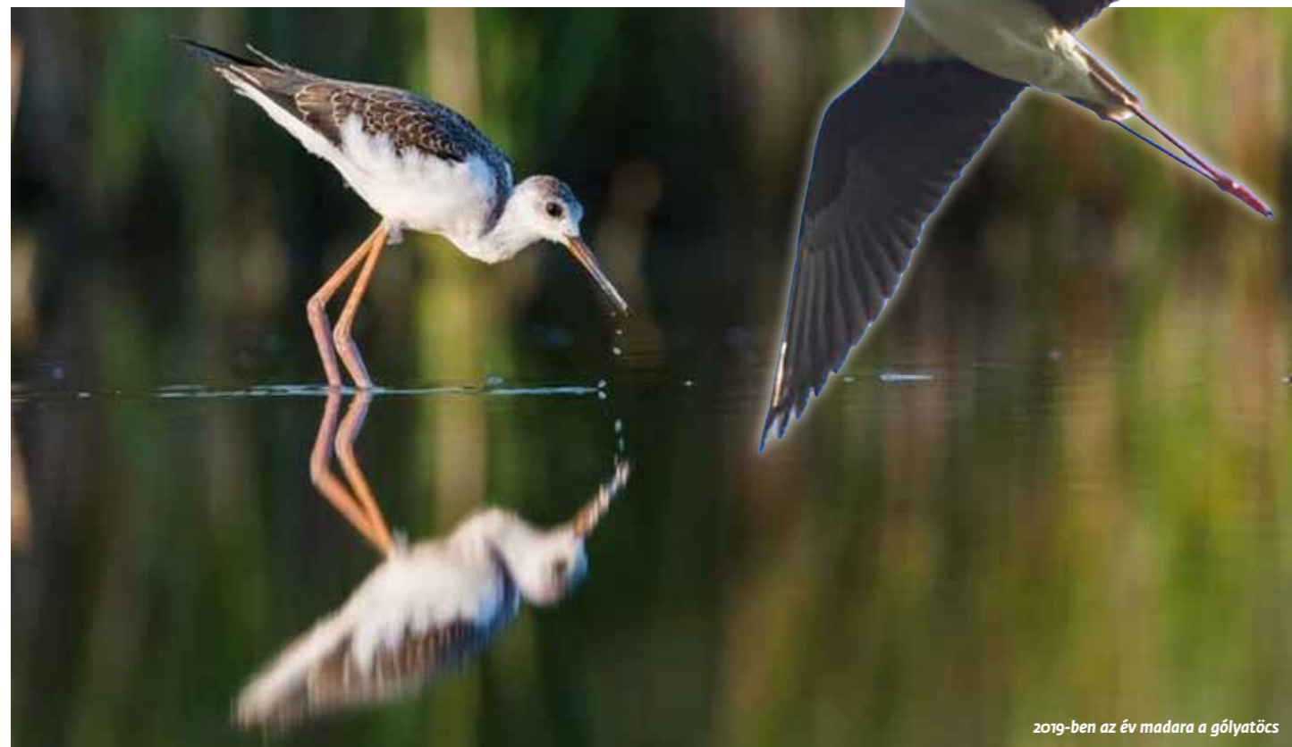
2019-ben az év madara a gólyatöcs