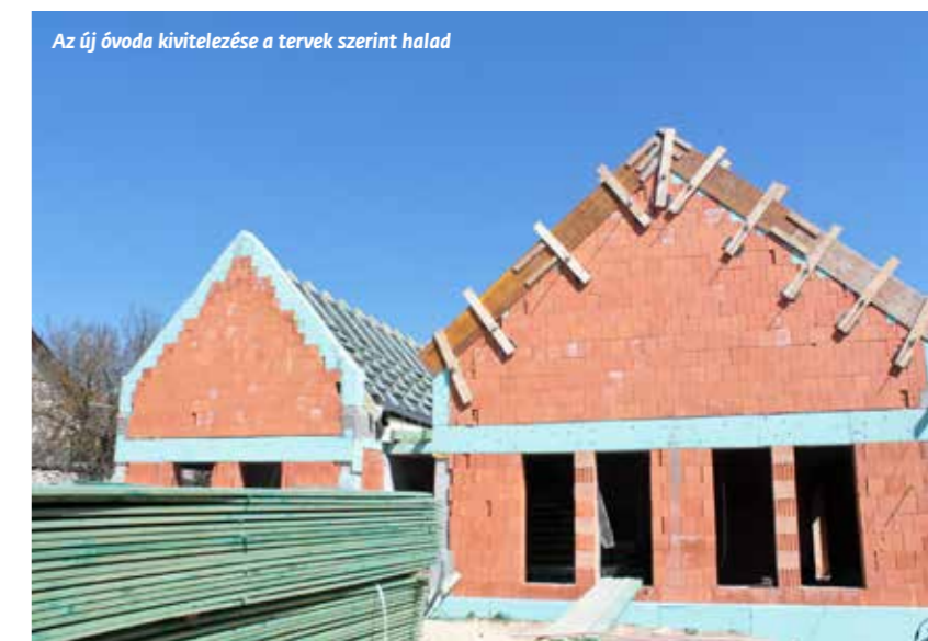
Az új óvoda kivitelezése a tervek szerint halad

Az állami beruházásként készülő tizenhat tantermes új iskola falai az eredeti tervek szerint emelkednek a magasba. A grandiózus oktatási intézmény műszaki átadása 2022 első negyedévére várható. A fejlesztés a műemlékvédelem által lebontandónak ítélt régi épületek eddigi használóit, többek között a város gondnokságot és a Biatorbágyi Önkéntes Tűzoltó Egyesületet is érinti. Ezen szervezeti egységekkel sikerült közös nevezőre jutni átmeneti elhelyezésüket illetően.