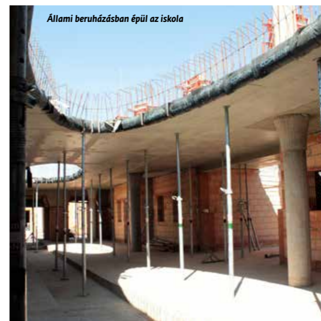
Állami beruházásban épül az iskola

A teljes egészében városi, önkormányzati forrásból létesülő új óvoda kivitelezése tavaly augusztusban kezdődött. A létesítmény az önkormányzat által korábban megvásárolt Nagy utca 29., 31., 33. szám alatti ingatlanokon valósul meg. A beruházás során a Szily-kastély és a biai református templom közé eső háztömbök környezetének teljes felújítására és rendezésére is sor kerül. A veszélyhelyzet miatt az építők nem tudják tartani az eredeti ütemtervet, ezért az intézmény 2020 szeptemberre tervezett megnyitását valószínűleg el kell halasztani.