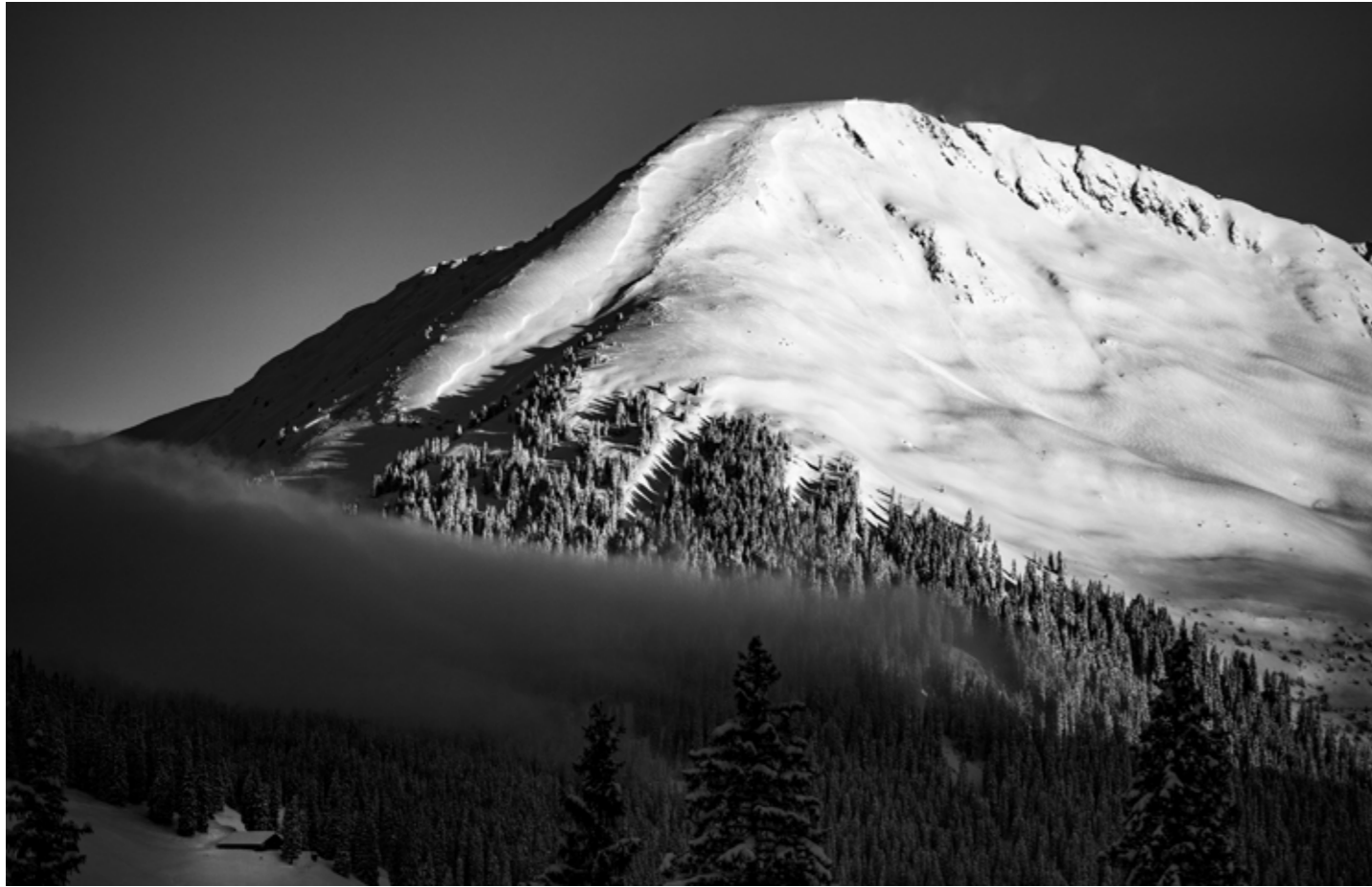
Kékesi Henriette: Pár lépés a mennyország. A kép Ausztriában készült egy gyönyörű reggelen, amikor a nap első sugarai megvilágították a hegycsúcsot. A cím az áhított boldogságra utal, amelyet nem ér el mindenki, pedig sokszor csak egy karnyújtásnyira van. Szécsényi Zsuzsa: Zebra. A felvétel a szerző számára talán legkedvesebb tájon, Toszkánában készült, Lajaticóban, amely Andrea Bocelli szülőfaluja. A dombra felkúszó fekete-fehér csíkok a learatott gabona textúráját és a zebra csíkjait idézik.