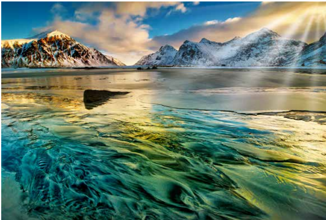
Kiss Borbála: Lofoteni strand

A tízéves születésnap ünnepségre parádés programmal készült az egyesület. Sok egyéb mellett vándorkiállítás szer-