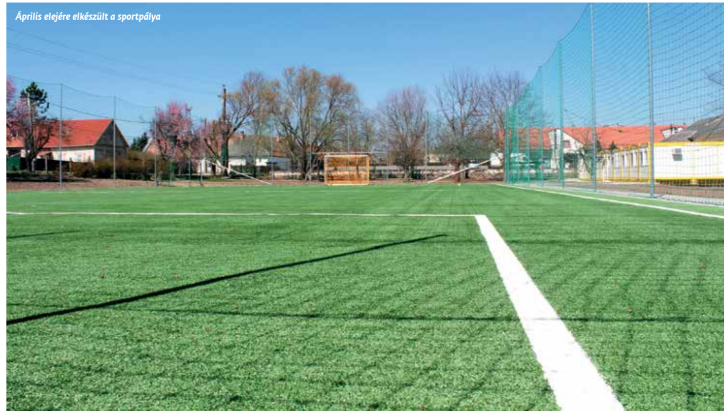
Április elejére elkészült a sportpálya

Április elejére elkészült az iskolák és a szülői közösségek által is szorgalmazott hússzor negyven méteres műfüves sportpálya a Sándor–Metternich-kastély udvarán, amelyet a diákok azonnal igénybe vehetnek, amint az oktatási intézmények kapui megnyílnak számukra.