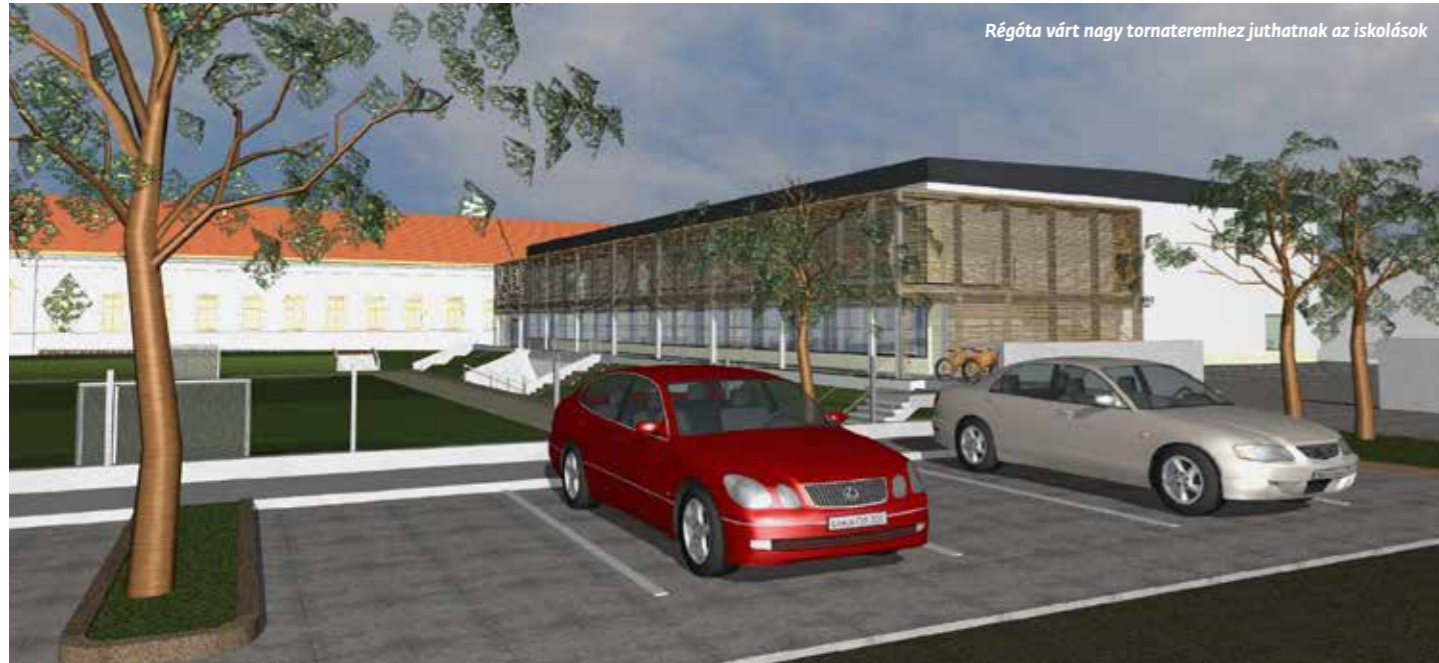
Régóta várt nagy tornateremhez juthatnak az iskolások