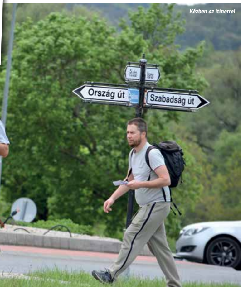
Kézben az itinerrel