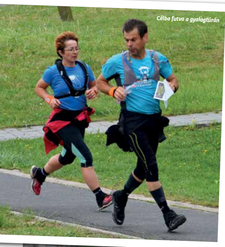
Célba futva a gyalogtúrán