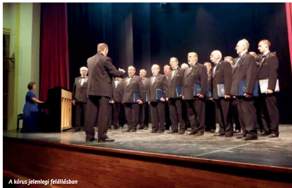
A kórus jelenlegi felállásban

Hat évtized munkájának összegzését, a művészeti munka bemutatását szolgálja