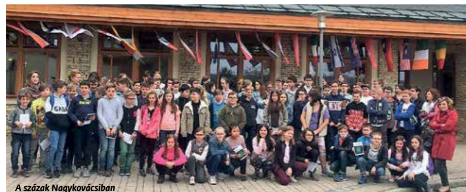
A százak Nagykovácsiban

Száz diákunk vett részt április 11-én a Nagykovácsiban lévő amerikai iskola angol nyelvű színházi előadásán. Műsorfüzetet kaptunk, és külön köszöntötték a