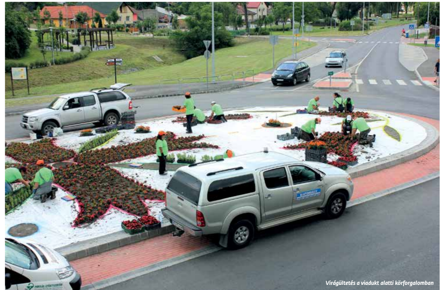
Virágültetés a viadukt alatti körforgalomban

o Olyan egyszerű civil szervezeti forma, amelyet legalább két természetes személy vagyoni hozzájárulás nélkül, nem gazdasági érdekű közös céljaik megvalósítására, közösségi célú tevékenységük összehangolására hoz létre. A civil társaság nem jogi személy, a társaság létrehozása nem igényel bírósági vagy hatósági bejegyzést, regisztrációt. A civil társaságra a polgári jogi társaságra vonatkozó szabályokat kell alkalmazni (azzal az eltéréssel, hogy az ügyvitelre kijelölt tag kivételével a tagságot bármely tag azonnali hatállyal felmondhatja).