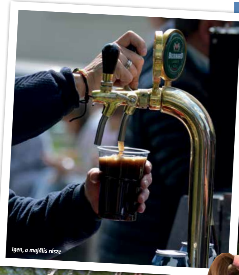
Igen, a majális része