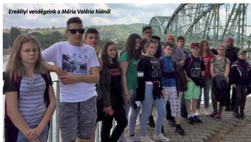
Eredélyi vendégeink a Mária Valéria hídnál