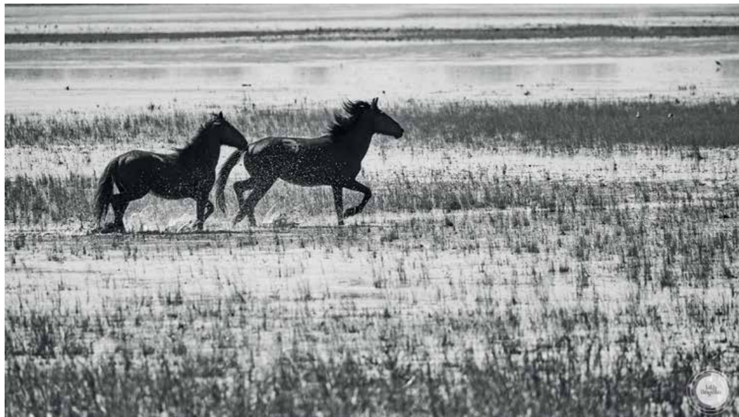
Fönn: Ketten, vágózó vadlovak a Duna-deltában (2018) Lenn: Umbria (2015)