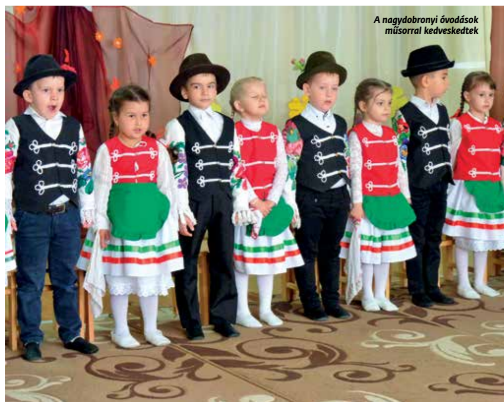
A nagydobronyi óvodások műsorral kedveskedtek