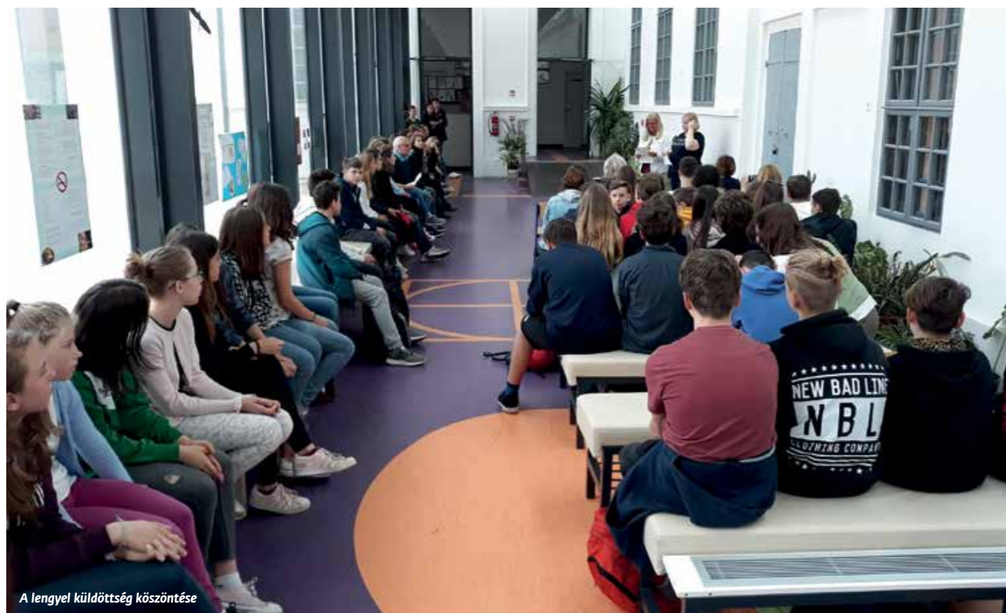
A lengyel küldöttség köszöntése