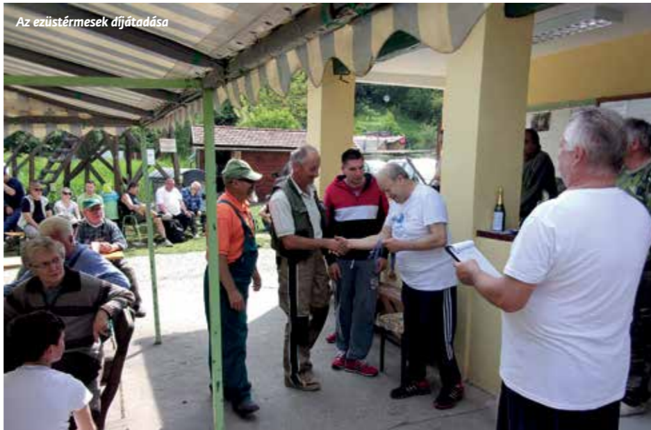
Az ezüstérmesek díjátadása

Az első hat helyezett csapatot, valamint a legnagyobb és a legkisebb halat kifogó versenyzőt értékelte a zsűri. Mérlegelés után a versenyen kifogott halakat vissza kellett engedni a tóba.