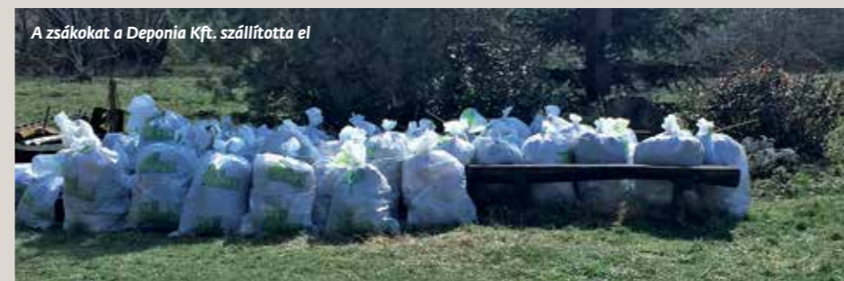
A zsákokat a Deponia Kft. szállította el