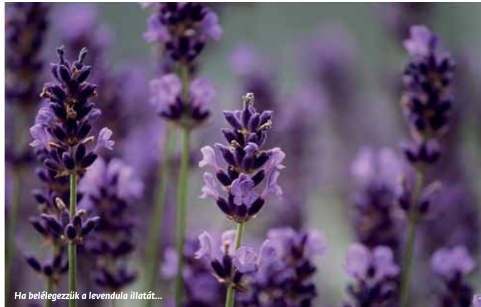
Ha belélegezzük a levendula illatát...

za, gyógyszeripari hatóanyag, ahonnan »kinyerhető« egy-egy vegyület, élő valóságában is gyógyító, kiegyensúlyozó lény, ember, állat, növény és termőföld közös-ségében.”