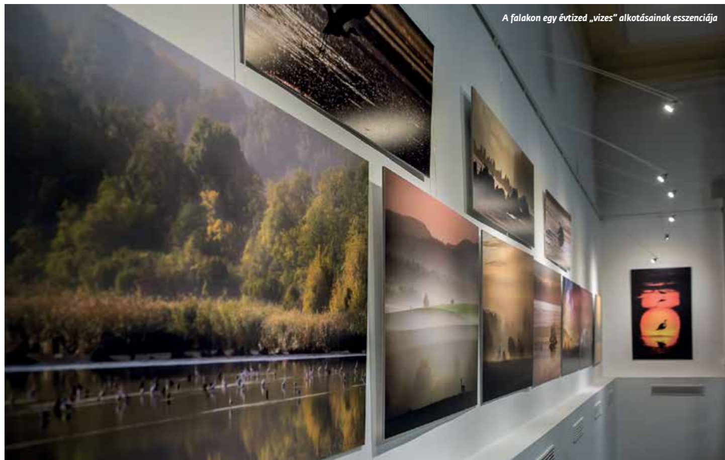
A falakon egy évtized „vizes” alkotásainak esszenciája