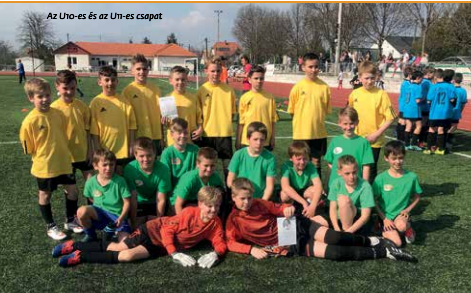
Az U10-es és az U11-es csapat