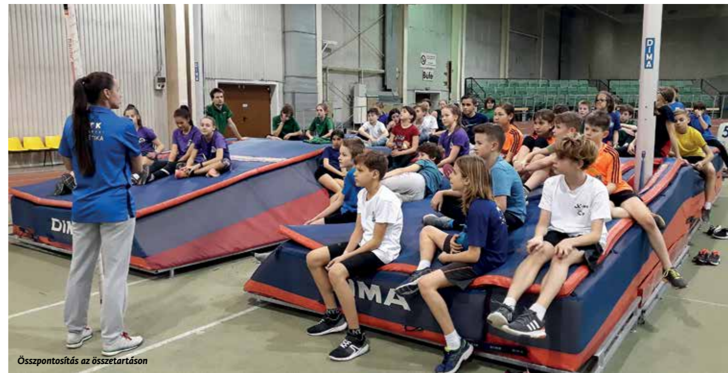
Összpontosítás az összetartáson