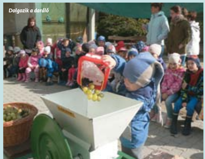
Dolgozik a daráló