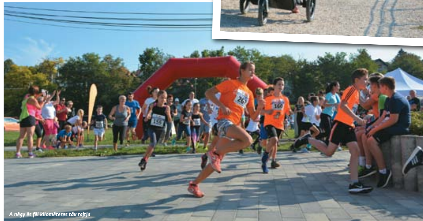
A négy és fél kilométeres táv rajtja