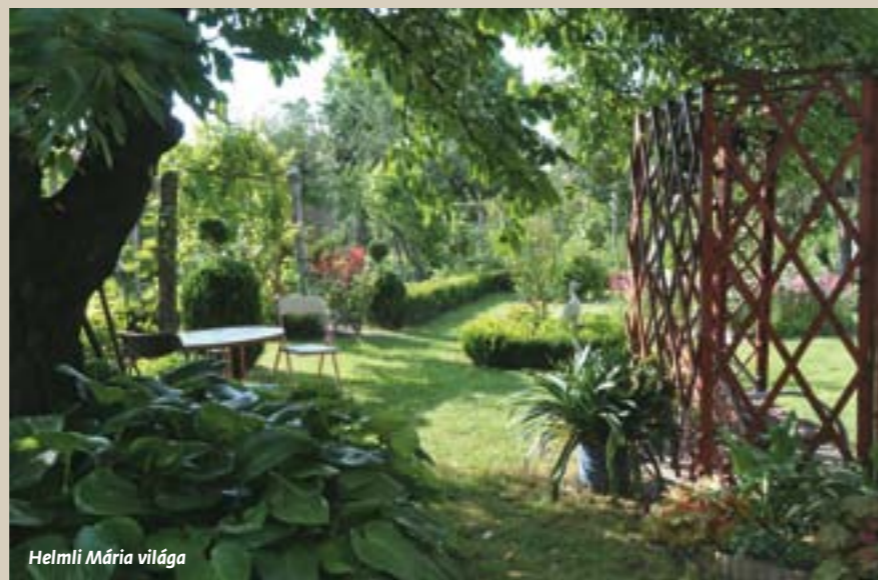
Helmlí Mária világa

Véget ért A legszebb konyhakertek verseny, amelyen hatodik alkalommal vettek részt a biatorbágyi kertbarátok. Ismét gyönyörű, gondozott, egészséges kerteket látogattunk végig, amelyek elkápráztatták a zsűrit, a SzázXSzép Faiskola kertészmérnökeit.