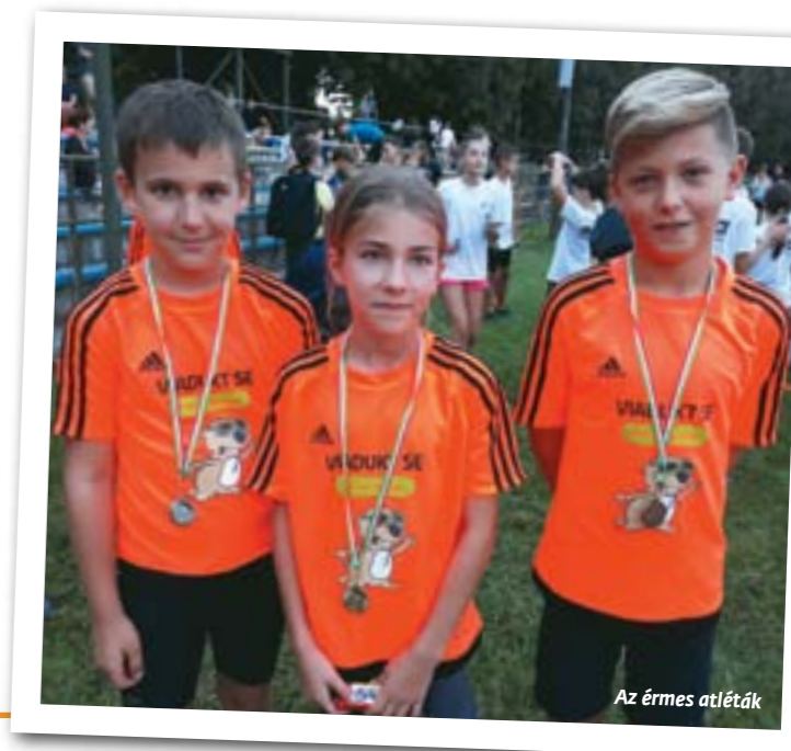
Az érmes atléták

Gratulálunk mindenkinek a szép eredményekhez!