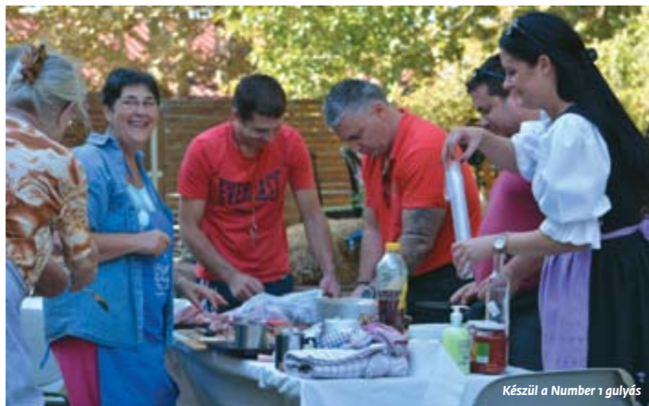
Készül a Number 1 gulyás

Akad jó pálinka is; igaz, ez nem kondérokba, inkább a főzők torkán át a gyoromba jutva katalizátorként szolgál... A vetélkedő csapatok: Fűzes-apukák, a hagyományörző egyesület gárdája, a Ritsmann-iskola szülőkből verbuválódott sza-