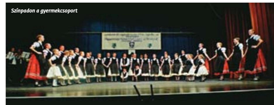
Színpadon a gyermekcsoport