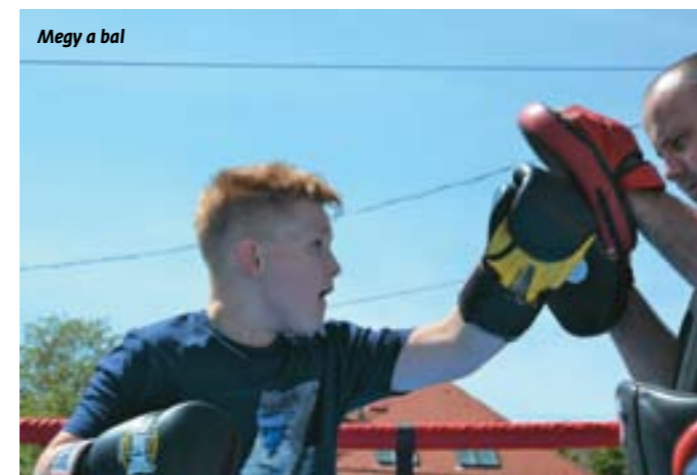
Megy a bal