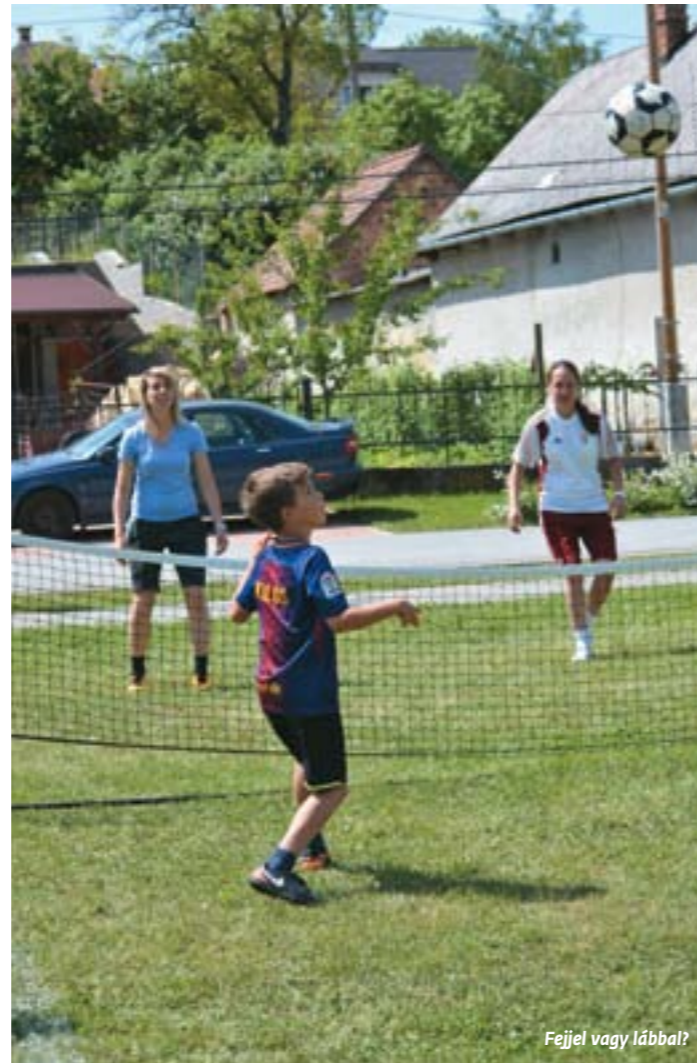
Fejjel vagy lábbal?

Majális volt a javából, hiszen a gondos szervezőmunka eredőjeként se szeri, se száma nem volt a biatorbágyiak által választható programoknak, kunsztoknak – és folytatása következik: hamarosan gyermeknap! KF