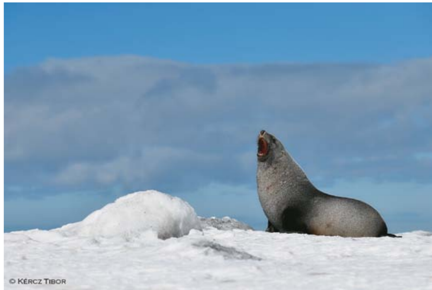
A Föld napjához kapcsolódva Olvadó jövőnk címmel nyílt kiállítás Kércz Tibor (a Biatorbágyi Fotóklub tagja) és Komáromi Csaba természetfotósoknak az Északi- és a Déli-sarkon készített képeiből a Magyar Természettudományi Múzeumban. Három sarkvidéki expedíciójuk anyagából összeállított válogatásuk június 2-áig látható. A tárlatot Áder János köztársasági elnök nyitotta meg április 20-án.