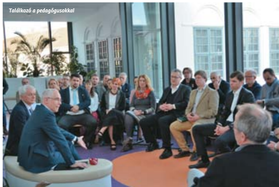
Találkozó a pedagógusokkal

gyon a születések száma növekszik, ebből fakadóan egyre több óvodai, iskolai férőhelyre van szükség. Az intézményi fejlesztés, felújítás terén történtek előrelépések, de tudott, hogy az infrastruktúra további korszerűsítést igényel. Meddig jutottunk, s hol kel még el a segítség – lényegében ennek felvázolása volt a nem titkolt célja a vendégfogadásnak, azaz felhívni a kormányzat figyelmét a még szükséges lépésekre az oktatást támogató beruházások, fejlesztések terén. A város oktatási struktúrája színes, hiszen a szülők a gyermekeiket állami, egyházi, alapítványi, nemzeti-ségi vagy művészeti iskolába írathatják be. A lehetőségek bővítésében, a feltételek javításában Biatorbágy partnere a kormány; ennek bizonyítéka, hogy a közelmúltban