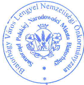
Fabók Géza sk. BVLNÖ elnöke