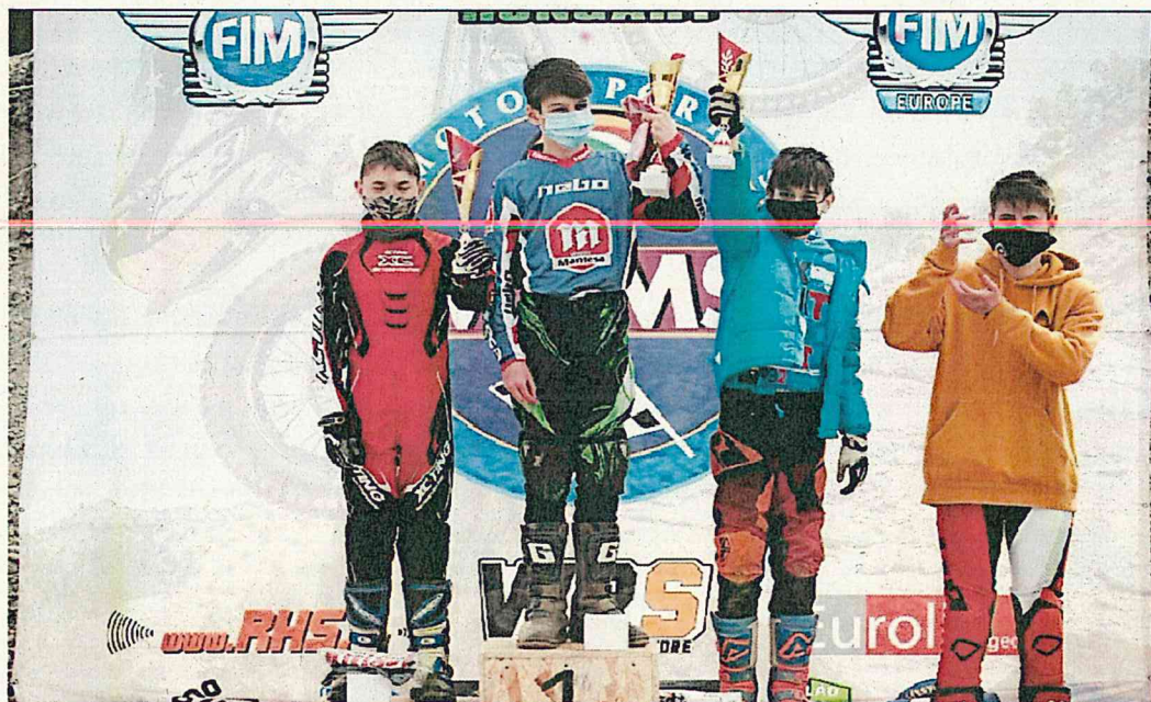
(jobb oldalt vagyok, kék kabátban)

2021. 06.12. Magyarország Nyílt Nemzeti Trial Bajnokság és MAMS Trial Kupa: 2. forduló, Sárisáp - 4. helyezés