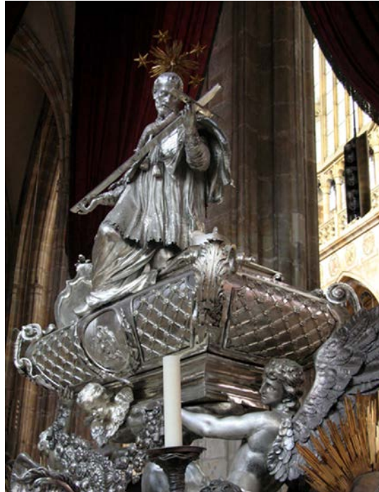
Nepomuki Szent János síremlékén lévő szobor, prágai Szent Vitus székesegyházban, 1736, Joseph Emmanuel Fischer von Erlach terve alapján,