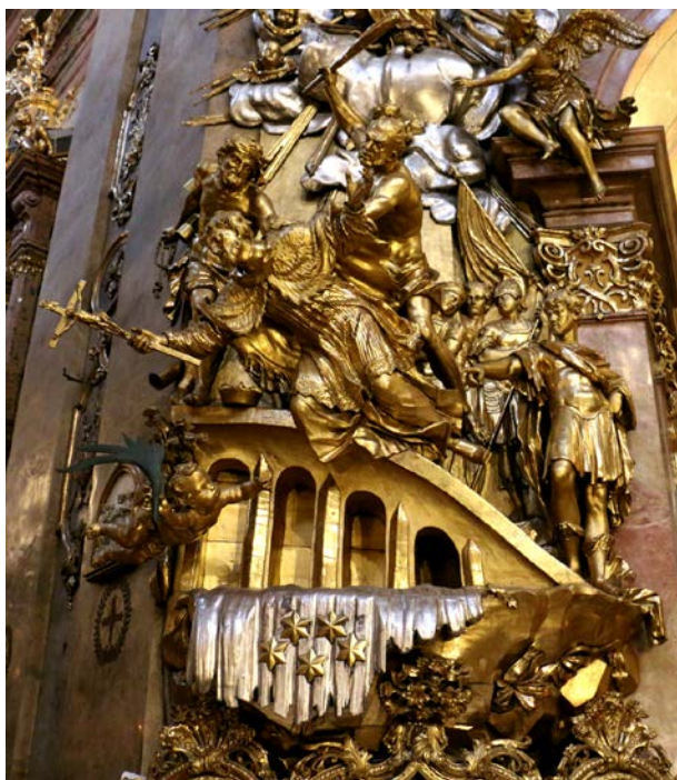
Nepomuki Szent János oltár, 1729, (Szentté avatása: 1729. márc 19.) Szent Péter templom, Bécs

Külföldi analógiaként érdemes megjegyezni a bécsi Szent Péter templomban levő Nepomuki Szent János mellékoltár szoborkompozícióját, mely különösen azért izgalmas, mert Nepomuki Szent János szentté avatásának (1729. márc. 19) évében készült.