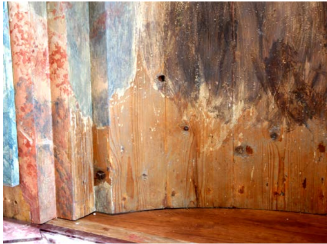
Kirajzolódott lenyomat, amit a márványimitáció körbevesz, Nepomuki Szent János oltár középrésze, Torbágy rk. templom, műtermi elhelyezés

Az 1747.-es Canonica Visitációban olvasható: