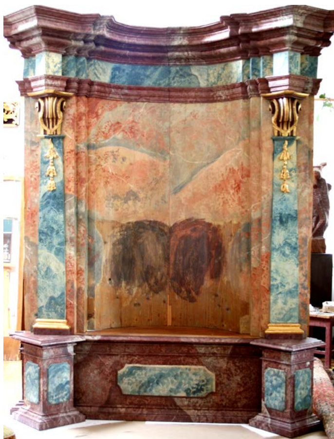
Kirajzolódott lenyomat, amit a márványimitáció körbevesz, Nepomuki Szent János oltár középrésze, Torbágy rk. templom, műtermi elhelyezés

Nepomuki Szent János mellékoltár restaurálásának első négy üteme 2009-ben fejeződött be. Az akkori restaurálás során a mellékoltár középrészén az átfestések eltávolítása után kirajzolódott egy hídnak, vagy valamilyen talpazatnak a lenyomata. A márvány imitációs festés abba maradt, a középrész felének magasságában. Tipikus barokk formavilágú térbeli tömeg lenyomata tárult fel a festéssel „körbe keretezve”. A pilaszterekhez közelebb eső részen az alapozás lecsurgásának nyomai is megfigyelhetők voltak. A pilaszterektől eltávolodva az íves rész belső része felé széles ecsetnyomok kerültek elő, melyeknek színe hasonló az oltár vörös márvány imitációjához, tehát feltételezhetően egyidős az oltárral. A predellán megtalálható a posztamens front síkjának kiterjedése a felülnézeten.