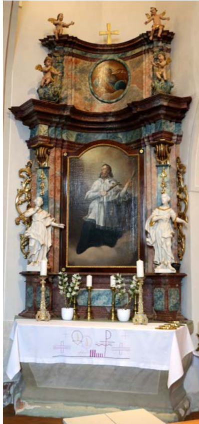
Restaurált Nepomuki Szent János mellékoltár, másodlagosan elhelyezett Nepomuki Szent János vászonképpel, Torbágy rk. templom

A kép a mellékoltár építményébe nem illeszkedik szervesen, egy későbbi áthelyezés során kerülhetett oda.