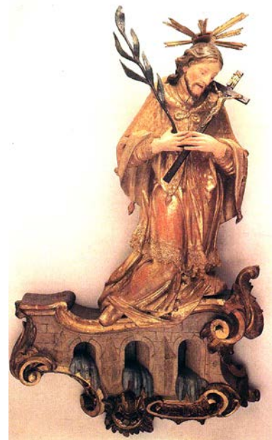
Ercsi kegytemplom Nepomuki Szent János mellékoltár szoborkopozíciója, 1767, Nemzeti Galériában Lövőről származó szobor