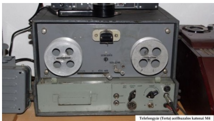
Telefongyári kat. acélhuzalós