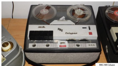
BRG M-8 Calypso