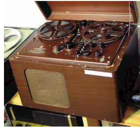
Brush BK-401 E.Á.