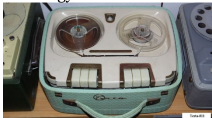
Terta TM-9 (Terta 811)