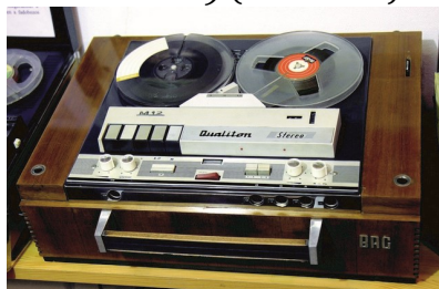
BRG M-12 sztereo proto