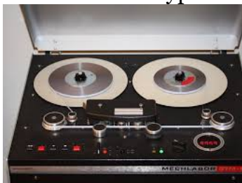
Mech. Labor STM-610