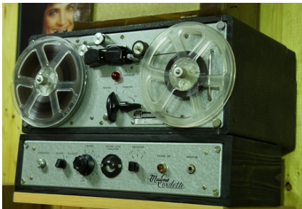
Magne recorder PT-6 E.Á.

Kiállítva összesen 460 darab, ezek mind működnek!