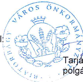
Tarjáni István polgármester

Pozitív visszajelzésükben bízva, tisztelettel: