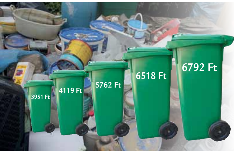
A 120 literes edények ürítési díjának változása máig

A Saubermacher azonnal és visszamenőleg emelt volna, de Batorbágy ellenállt, így valamelyest sikerült lefékezni a 2012. évi árnövekedést. Ennek ellenére az egy évre meghosszabbított szerződés értelmében decemberre közel a duplájára emelkedtek városunkban a lakosság által fizetendő kukadíjak.