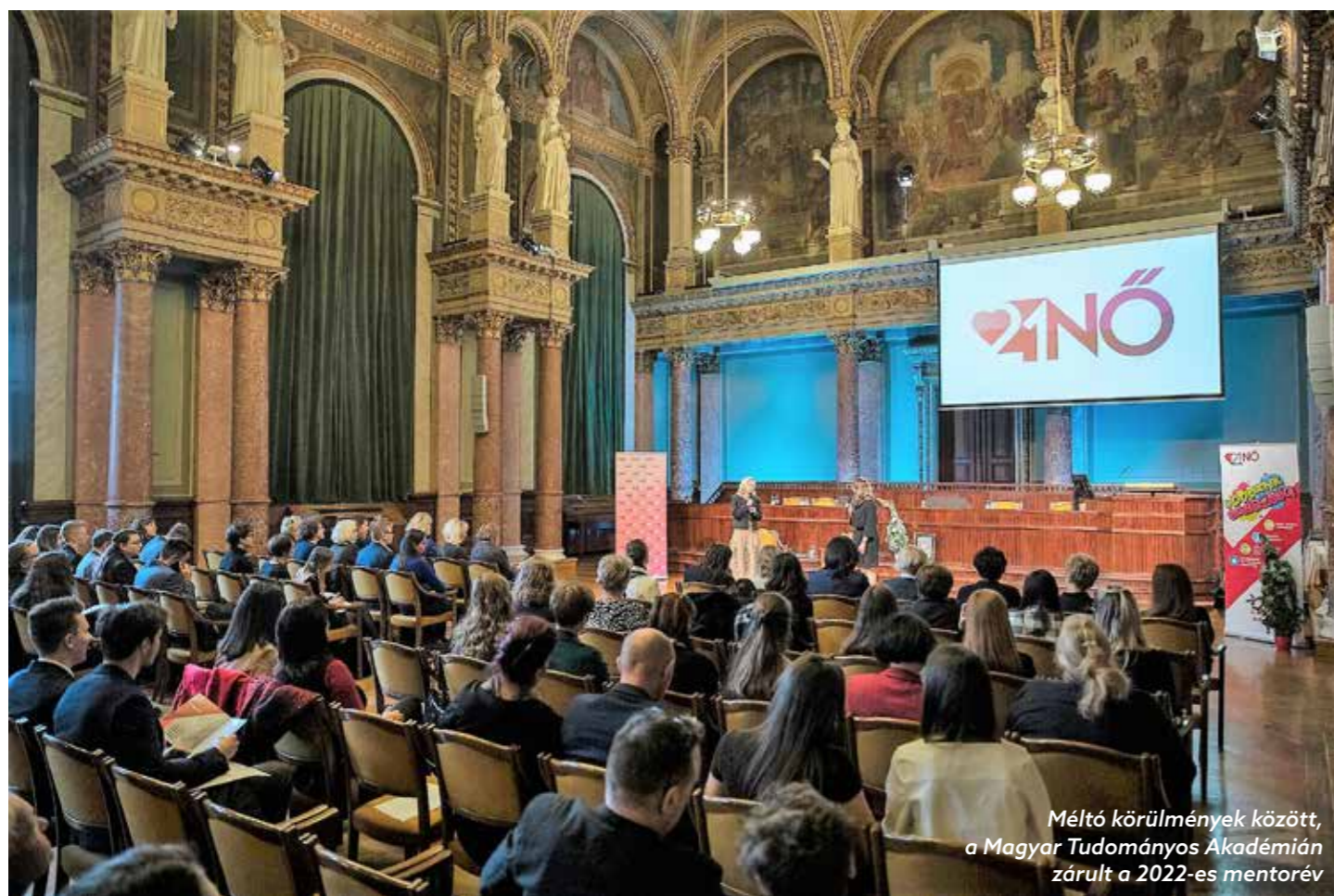
Méltó körülmények között, a Magyar Tudományos Akadémián zárult a 2022-es mentorév