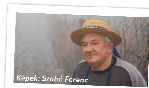
Képek: Szabó Ferenc