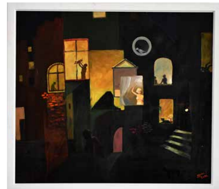
Az Ablak című festmény 2022-ben készült