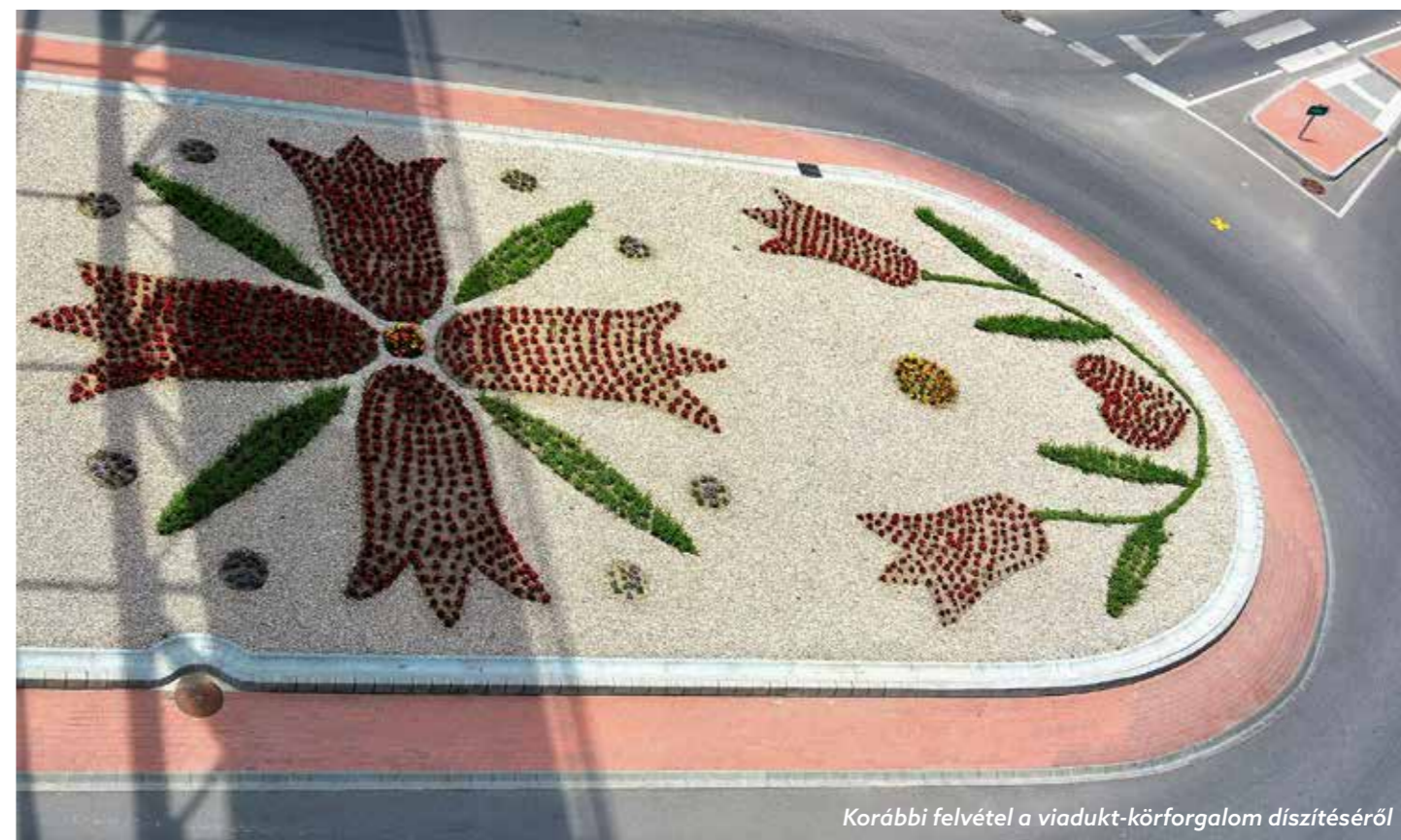
Korábbi felvétel a viadukt-körforgalom díszítéséről

A városgondnokság nélkülözhetetlen szerepet tölt be a település közintézményeivel összefüggő karbantartási feladatok ellátásában.