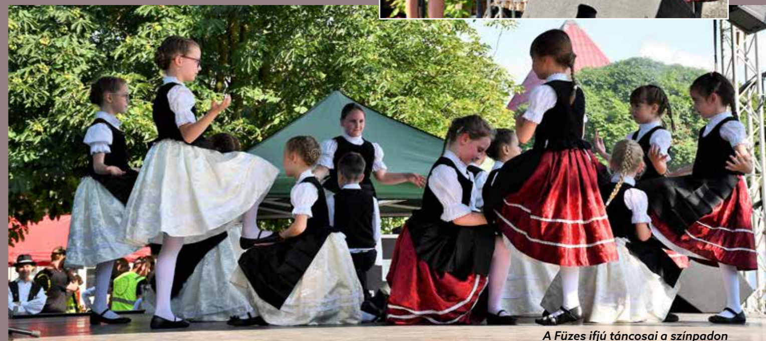
A Füzes ifjú táncosai a színpadon