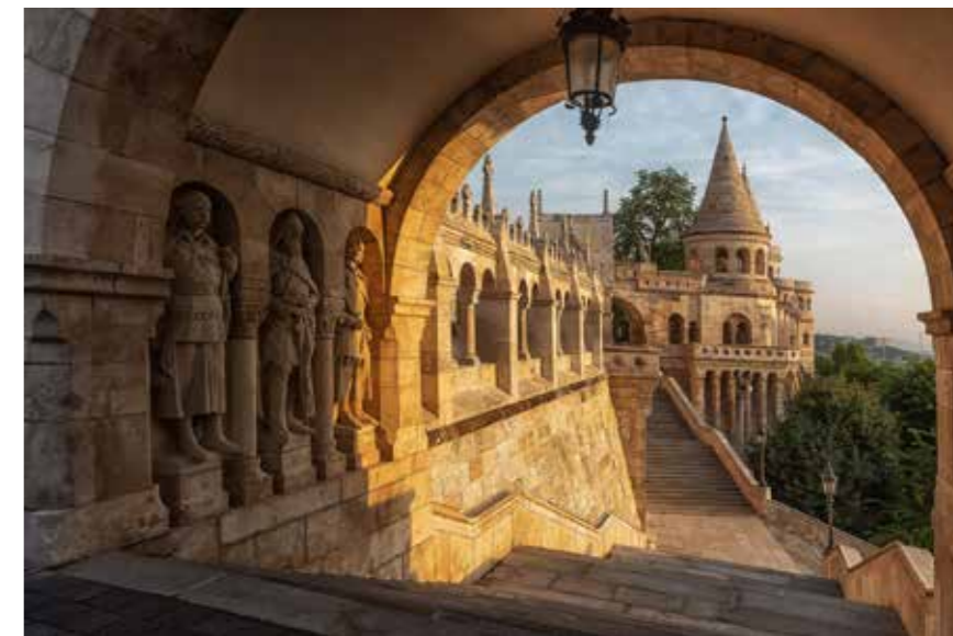
Zelkó Csilla, Fisherman's Bastion