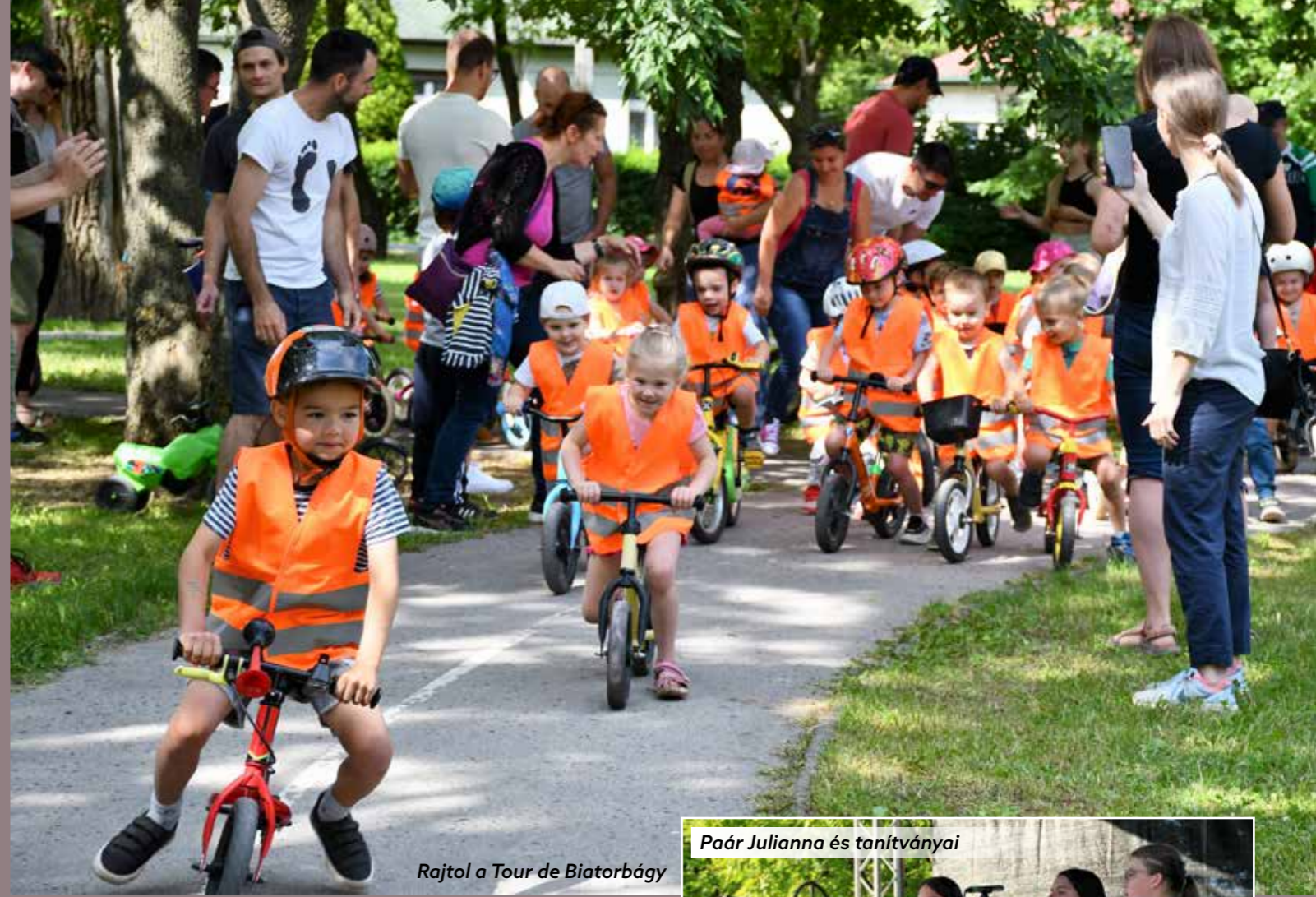
Rajtol a Tour de Biatorbágy

S hogy mi volt még a 2023. évi városünnep kínálata június 16. és 18. között? Íme: kézművesvásár; városnéző kisvonat; kerékpáros programok a Budavidéki Zöldút bringásaival; Sarkadi József templommakett-kiállítása;