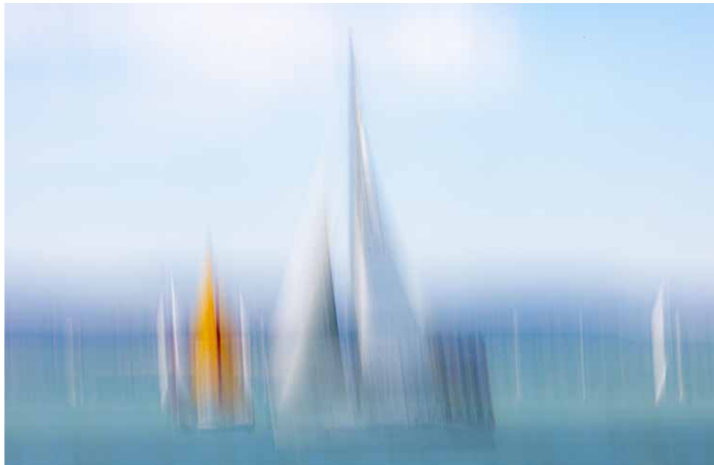
Kékesi Henriette: Álomhajók. A kép az idei Kékszalag vitorlásversenyen készült. A hosszú záridő miatt kissé elmosódottá váltak a vitorlások, ezzel álomszerű hangulatot kölcsönözve a fotónak.