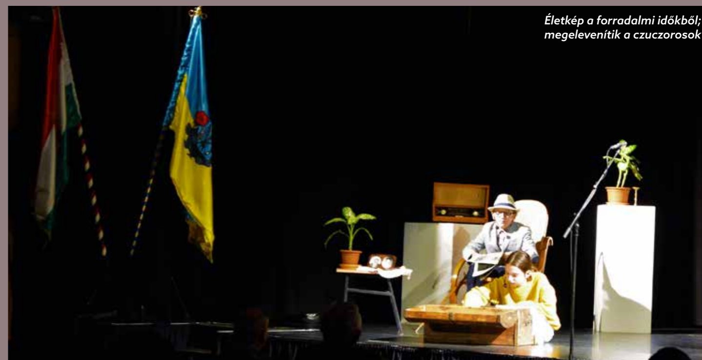
Életkép a forradalmi időkből; megelevenítik a czuczorosok