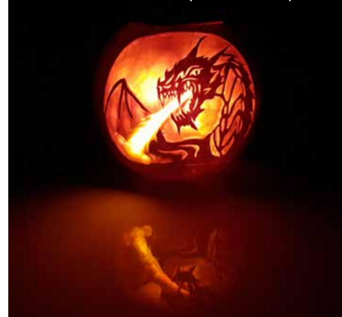
A tőkelső alkotás: Tüzes sárkány a RémiszTök csapatától

Bár nem volt előzetesen meghirdetve, az alkotások láttán a háromtagú zsűri kérte a különdíj kategória felvételét. Nánási-Kézdy Tamás zsűritag, az értéktárbizottság elnöke úgy fogalmazott, hogy a három helyezés kevés volt az igazán különleges pályamunkák elismeréséhez, így két csapat továbbgondolt, komplex és mesészerű alkotásait is bevalogatták az elismert tökök közé – azaz különdíjasok lettek.