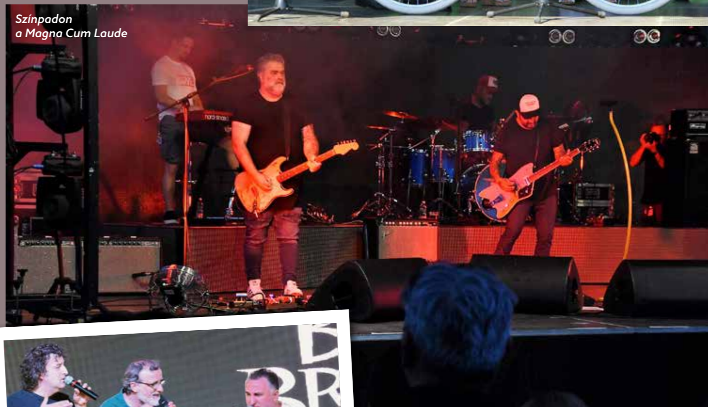
Színpadon a Magna Cum Laude