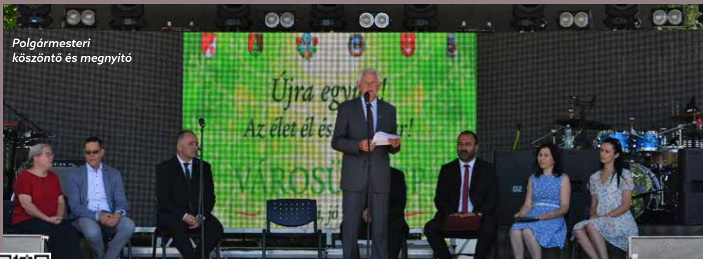
Polgármesteri köszöntő és megnyitó