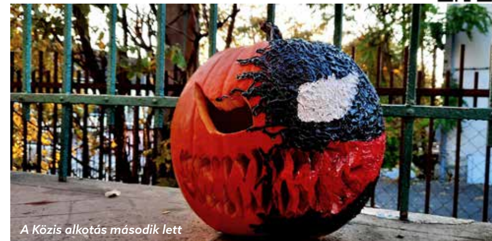
A Közis alkotás második lett

A program során a Pöttyös Pajtki biztosították a jó hangulatot és kötötték le a figyelmet lufihajtogatással. Ők az esemény különdíjasának, a Dream Team nevezetű családi