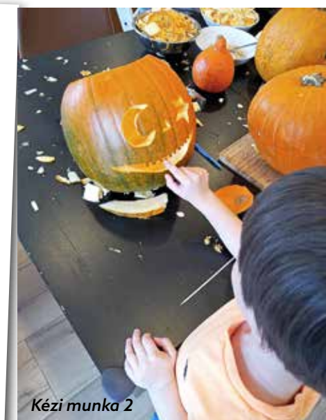
Kézi munka 2