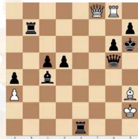
Horváth József (2435) - Tóth Ervin (2447) 2. feladat, sötét lép, 1 pont