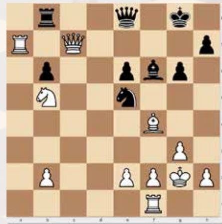
Juhász Kristóf (2474) - Davor Rogić (2467) 3. feladat, világos lép, 2 pont