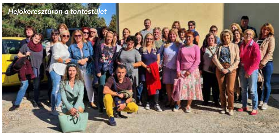
Hejőkeresztúron a tantestület

Komplex alapprogram, Komplex instrukciós program. A szakmai berkekben csak hejőkeresztúri modellként emlegetett módszertannal elméletben egy éve, a gyakorlatban fél éve foglalkozik a Biatorbágyi Általános Iskola és Magyar-Angol Két Tanítási Nyelvű Általános Iskola pedagógusközössége. Az intézményvezető szervezésében a tantestület többsége elvégezte a Komplex alapprogram továbbképzését.