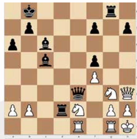
Seres Lajos (2409) - Torma Róbert (2424) 1. feladat, sötét lép, 1 pont