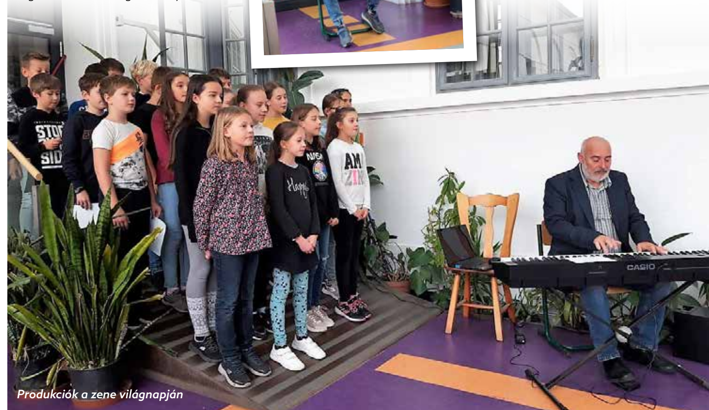
Produkciók a zene világnapján

izgalmas kihívásokkal néztek szembe, és fantasztikus élményekkel gazdagodva tértek vissza a felszínre.