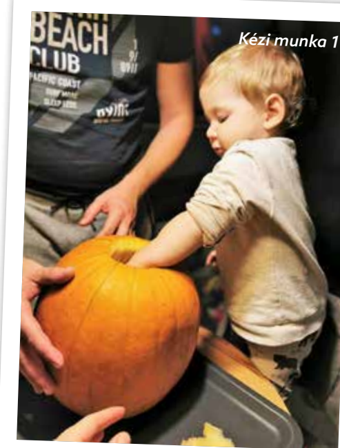
Kézi munka 1