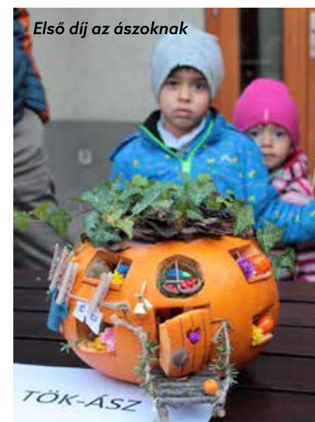
Első díj az ászoknak