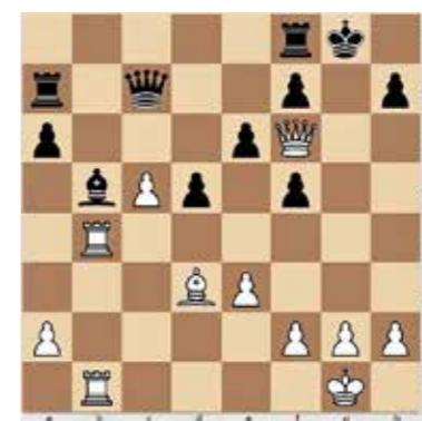
1. feladat, világos lép. 1 pont

Erre a kis ismertetőre azért volt szükség, hogy a következő számban játékerejüket tekintve majd el tudjuk helyezni a magyar sakkozókat a világban és főleg a biatorbágyi csapatot a hazai sakkéletben. Addig is néhány adat. A legmagasabb értékszámú sakkozó a világon Magnus Carlsen, a világbajnok 2847 ponttal; a legjobb magyar Rapport Richárd, tizenegyedik a világranglistán, 2763