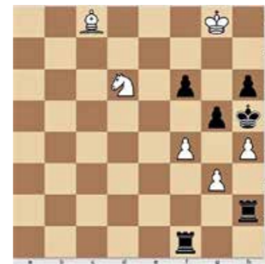
3. feladat, világos lép. 4 pont

ponttal. A biatorbágyi csapat legmagasabb pontszámú játékosa, Bokros Albert 2458, a legjobb biatorbágyi lakos Felméry Máté 2181 ponttal bír. Egy kezdő versenyző pontszáma 1000 (aki már amatőrök között jó játékosnak számít).