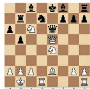
2. feladat, világos lép. 2 pont