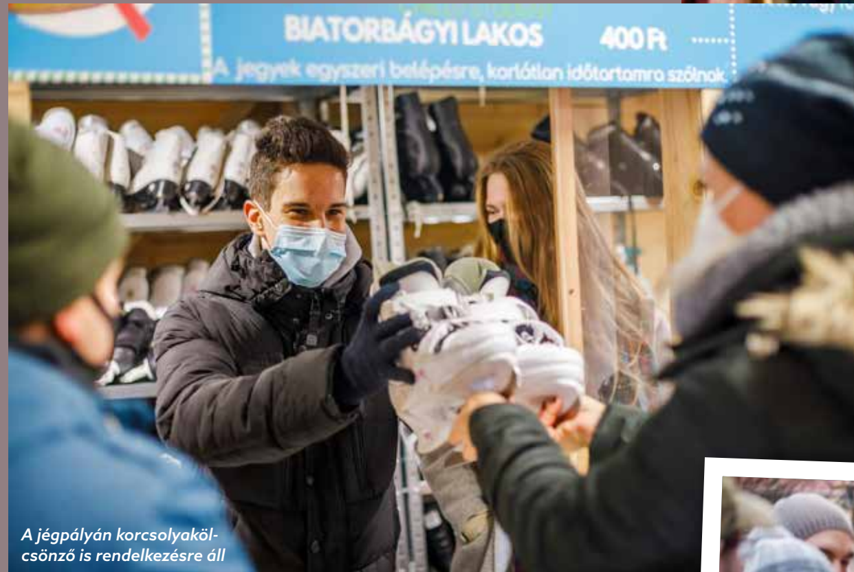
A jégpályán korcsolyakölcsönző is rendelkezésre áll