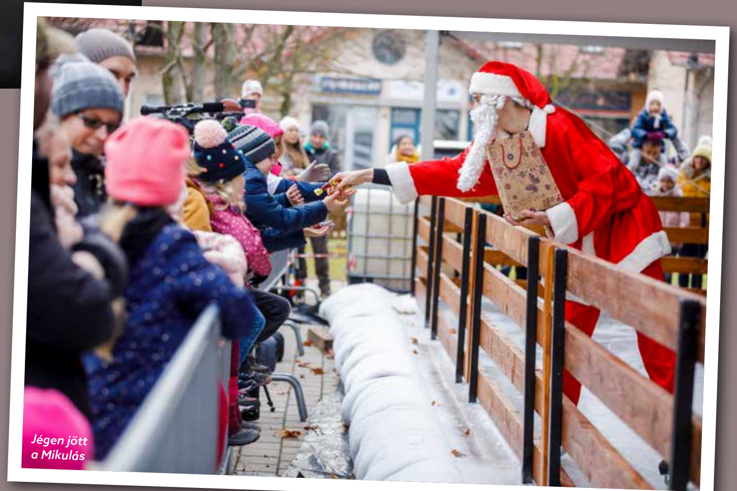
Jégen jött a Mikulás