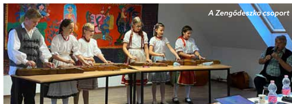
A Zengődeszka csoport

Sajnos a decemberre tervezett adventi rendezvényeink a súlyosbódó járványhelyzet miatt elmaradnak.