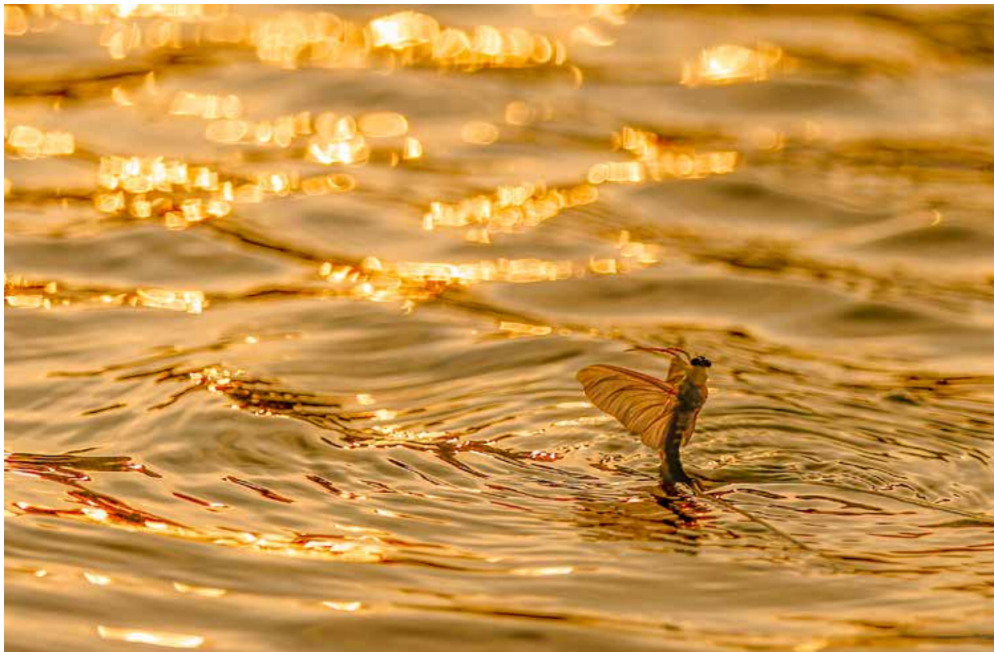
Virág Tünde: Arany folyó. A tiszavirág európai és világszinten is jelentős természeti örökségünk. A lárvák növekedése nagymértékben függ hőmérséklettől, a fejlődés befejeződése váltja ki a rajzást, amelyet Tiszainokán június végén örökítettünk meg.