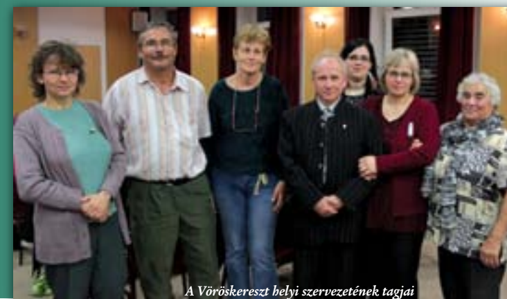
A Vöröskereszt helyi szervezetének tagjai