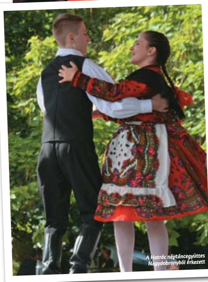
A Hatrác néptáncgyűjtés Nagydobronyból érkezett