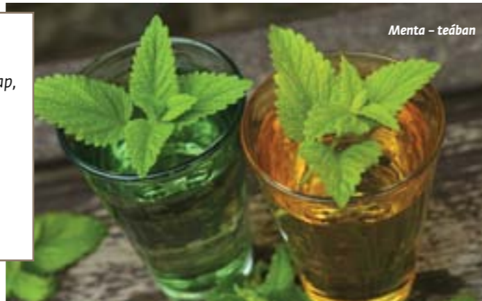
Menta - teában

Augusztus küzd az őszi haddal, Nem ringat jégmadárt a hab. Egy percet elveszít a nappal, Egy sugárt a pirkadat...” (Victor Hugo)