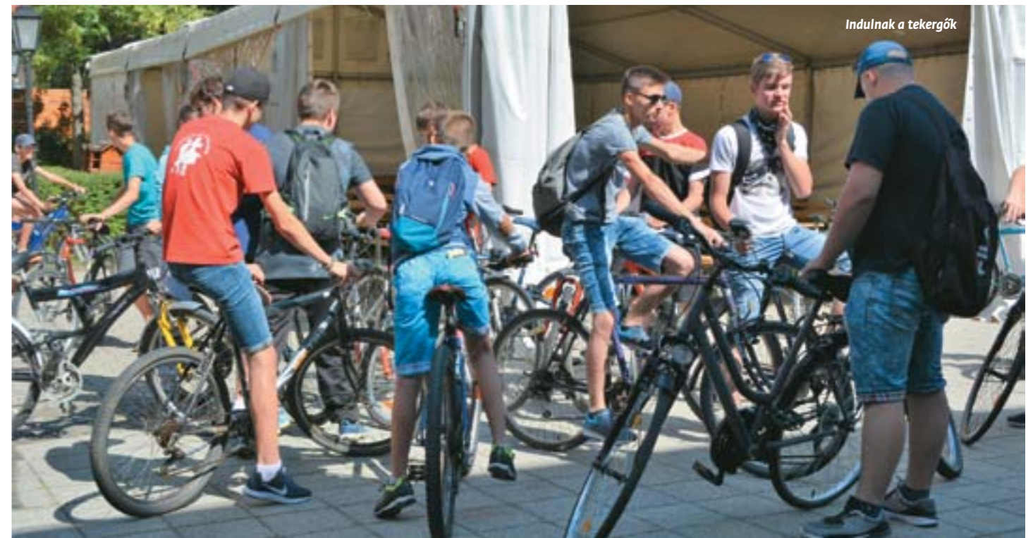
Indulnak a tekerők

A Városünnep Biatorbágy testvértelépülései számára is hagyományos találkozási pont és alkalom, így Nagydobronyól és Gyergyóremetéről is érkezett kerékpáros csapat. Magyarok együtt, közösen az anyaországban, testvértelépüléseken élő testvérek – nyeregen... –király-