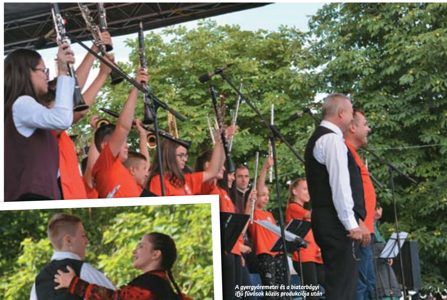
A gyergyóremetei és a biatorbágyi ifjú fúvósok közös produkciója után