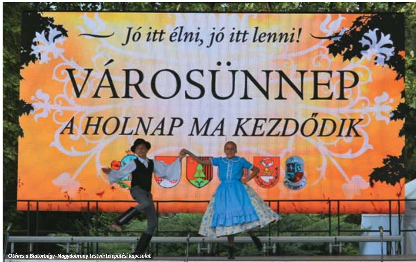
Öt éves a Biatorbágy–Nagydobrony testvértelepülési kapcsolat