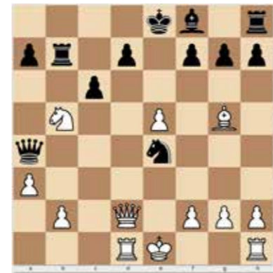
Világos lép, és három lépésben védhetetlen mattot ad. 3 pont

1986-ig négy ezüstérmet nyert az Ivánka Mária és Verőczy Zsuzsa nevével fémjelzett csapat. Azután jöttek a Polgár lányok. Az 1988-as olimpiai aranyérmes csapat tagjai: Polgár Zsófia, Polgár Judit, Mádl Ildikó, Polgár Zsófi. A lányok negyvenkét partiból csak egyet (!) vesztek, Polgár Judit tizenhárom partiból 12,5 pontot ért el! Két év múlva azonos összeállításban megvédték a bajnoki címüket. A következő, 1994-es olimpián úgy lettek bronzérmesek, hogy Polgár Judit a női helyett már a férficsapat első tábláján játszott. Azóta sajnos nem nyertünk érmet. Polgár Judit a világ elismerten legjobb női sakkozója, róla a következő számban írok.