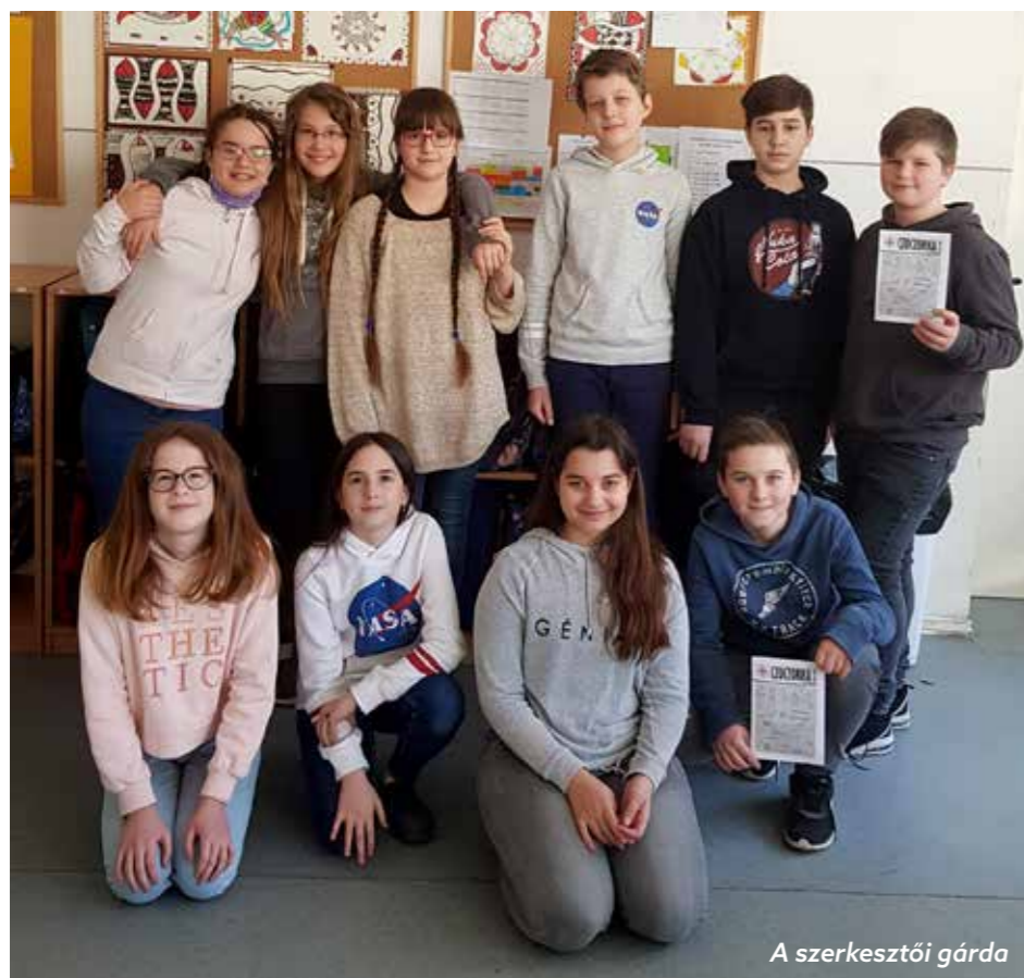
A szerkesztői gárda