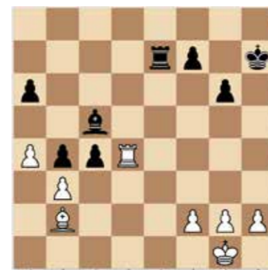
Világos lép, és négy lépésben védhetetlen mattot ad. 2 pont