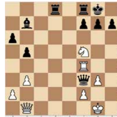
Világos lép, és két lépésben védhetetlen mattot ad. 1 pont