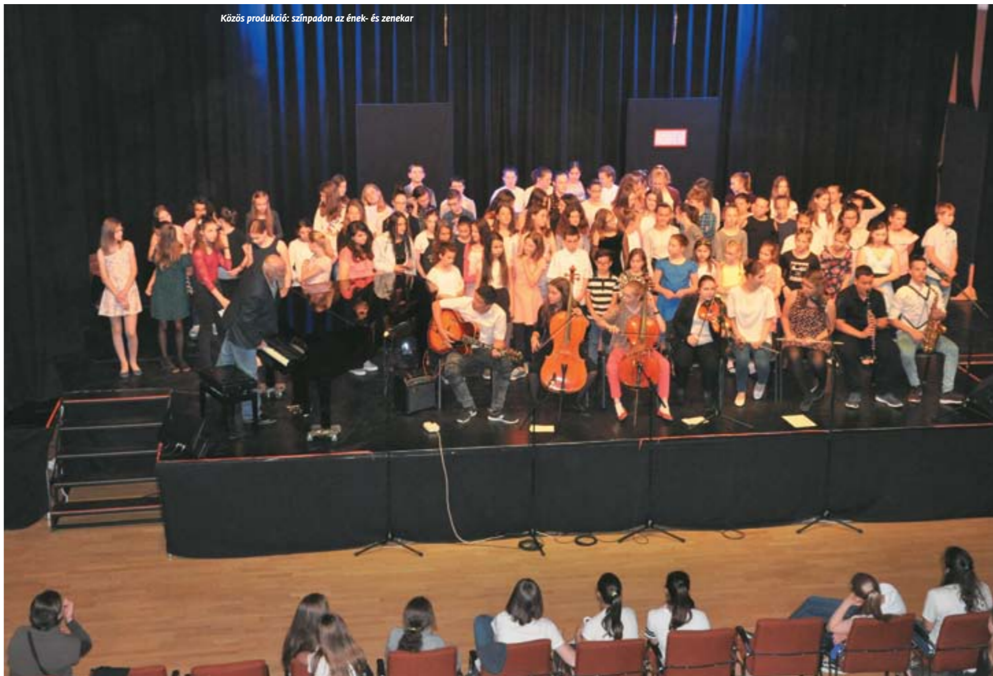
Közös produkció: színpadon az ének- és zenekar