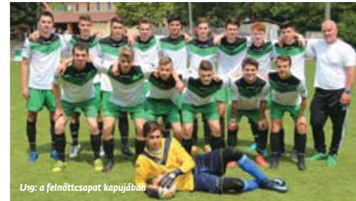
U19: a felnőttcsapat kapujában

A két legidősebb korosztályunk (U17-es, U19-es) számára még egy forduló hátravan a harmadosztályú bajnokságból, a fiatalabbak küzdenek a dobogó legsó fokáért, míg legidősebb utánpótlás-korosztályunk számára a bronzérem már biztos, és kis szerencsével akár ezüst is kerülhet a nyakukba.