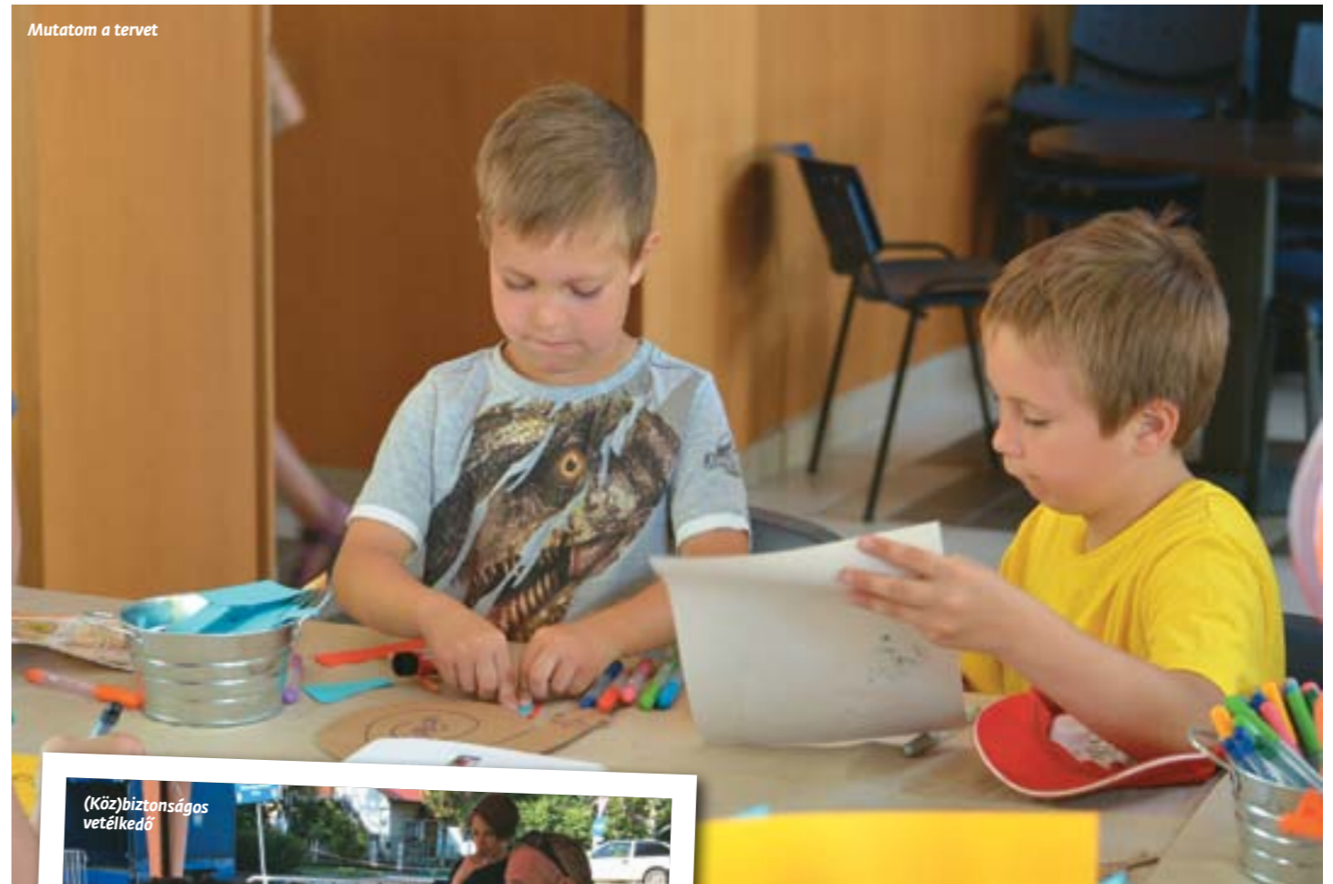
Mutatom a tervet