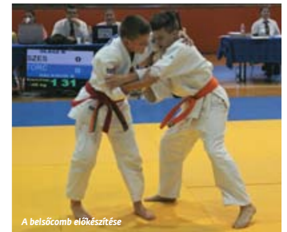
A belsőcomb előkészítése