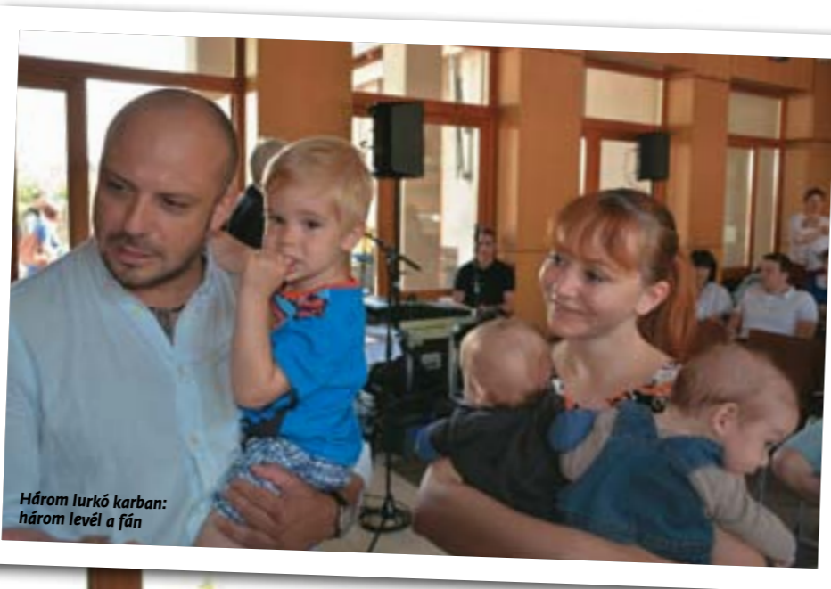
Három lurkó karban: három levél a fán

A város évente kétszer köszönti újdonsült polgárait: ezúttal harmincegy kislányt és harminc kisfiút. A tavaszi alkalomra a gyermeknap városi rendezvény keretében került sor, így adva hangsúlyt a születésnek, a szülői gondoskodásnak járó tiszteletnek.