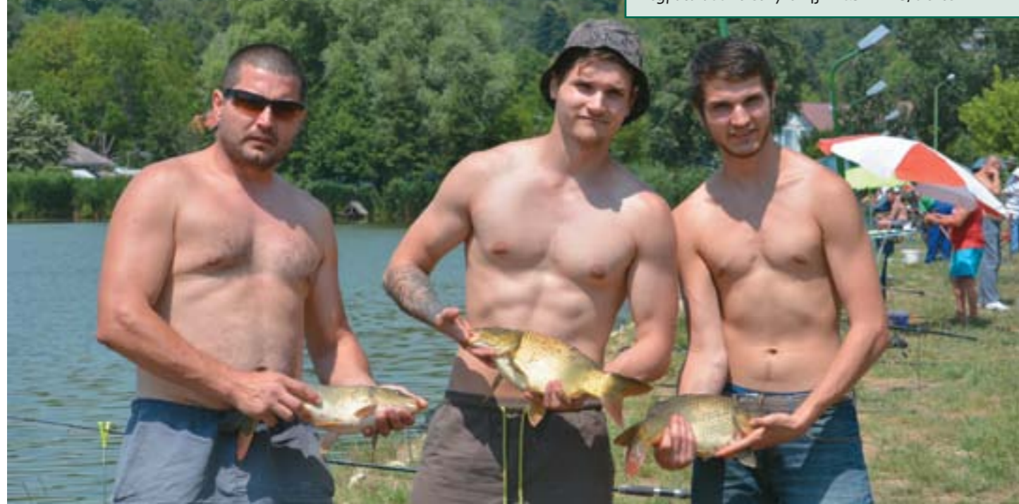
A kategóriagyőztes Hámori Team és fogásuk (egy része)

A verseny során bárki botot ragadhat az egyesületi tagokon túl, és háromfős csapatokba tömörülve, tagonként egy-egy horgászbót csatasorba állításával (tartalék botok persze a talonban) teheti próbára a szerencsését, és bizonyíthatja horgásztudását. Családok, barátok, klubtagok, ismerősök állnak ilyenkor össze – köztük hölgyek is –, így alkotván triumvirátusokat. Idén harminchat gárda és szurkolóik álltak a tóparton, hogy a verseny kezdetén vízbe vetve a horgot, várjanak a fogásra.