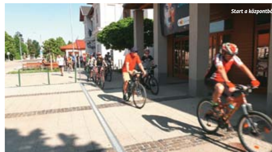
Start a központból

az aszfaltcsíkon vezet, terepen is egyensúlyoznak a biciklisek, s ott bizony változatos a táj, emelkedőket is le kell küzdeni.