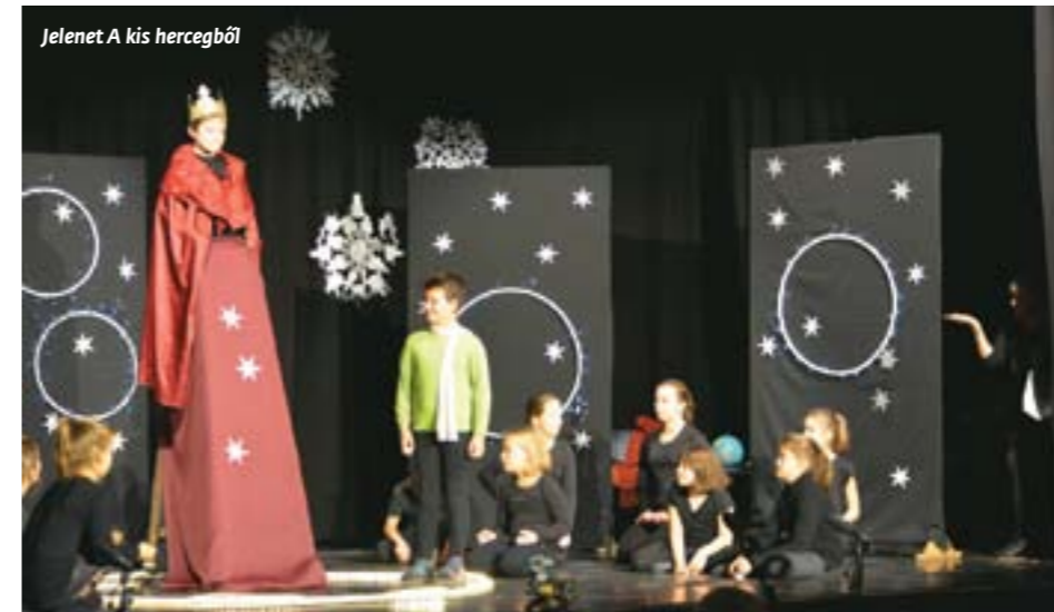
Jelenet A kis hercegből