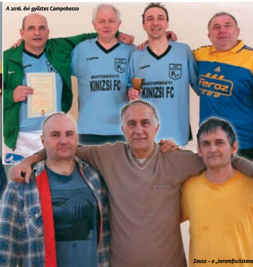
A 2016. évi győztes Campobasso