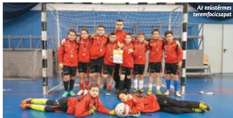
Az ezüstérmes teremfocicsapat