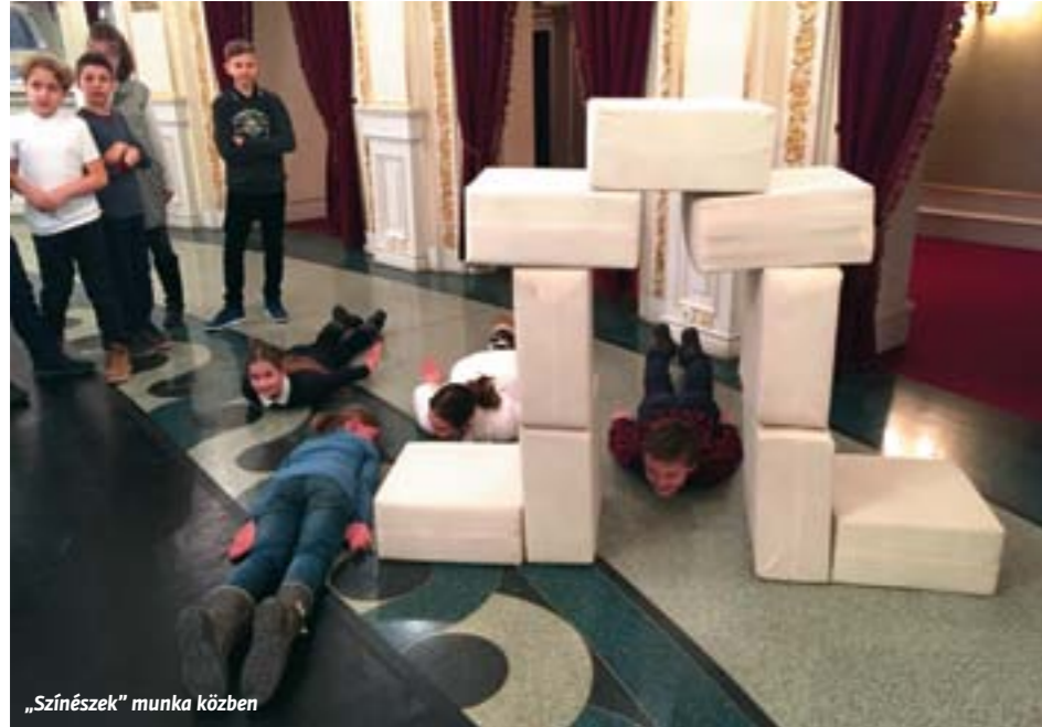
„Színészek” munka közben