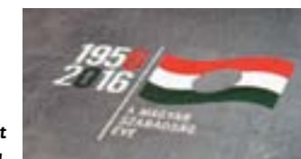
A kiállítás megrendezését az 1956-os Emlékbizottság támogatta.