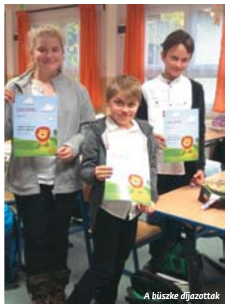
A büszke díjazottak

A Generali Biztosító Zrt. által meghirdetett országos rajzpályázaton a fődíjat