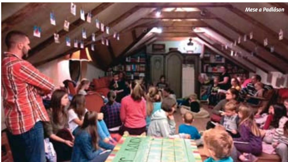
Mese a Padlásán