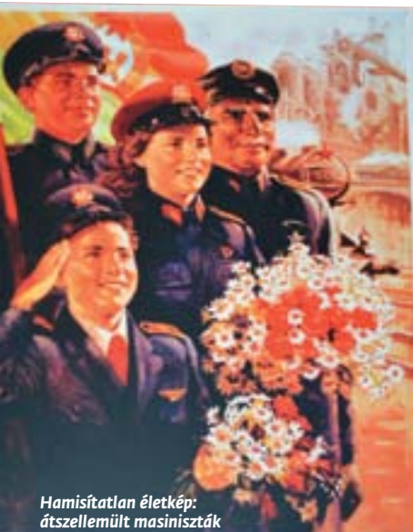
Hamisítatlan életkép: átszellemült masiniszta

leverését követő megtorlásig, majd a Kádár nevével fémjelzett árulás korszakáig, gyakorlatilag a rendszerváltásig. A kommunista rendszer sötét, embertelen világa, a nemzettudat érzésének rendszerszintű üldözése elevenedett meg – azaz inkább dermedt kővé – a Faluház előterében. Két- és háromdimenziós, részben elfeledett műalkotások, tárgyak jelentek meg a berendezett térben, amelyek vagy részei voltak az '56-ot öve-