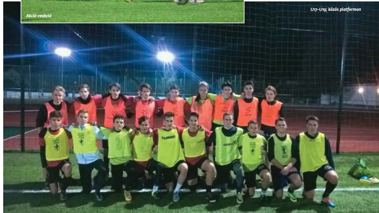
U17–U19; közös platformon

Az U17-es korosztályhoz hasonlóan az U19-ben is ugyanaz a helyzet alakult ki a tavalyi évben a Budakeszi Labdarúgó Aka-