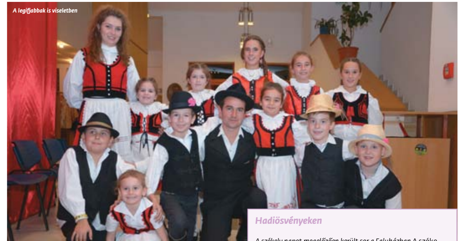
A legifjabbak is viseletben