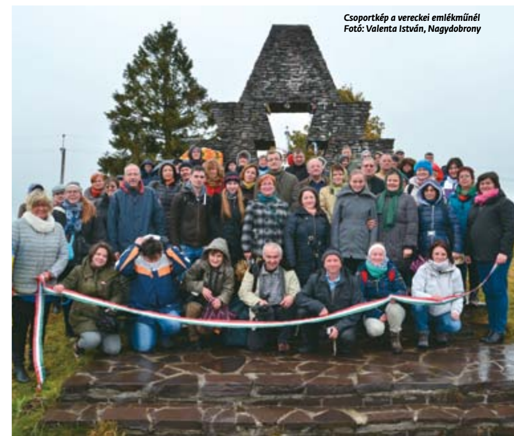
Csoportkép a vereckei emlékműnél