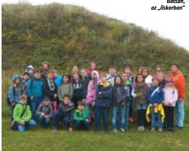
Battán, az „őskorban”

Az állatok világnapja mindig remek alkalom arra, hogy felhívjuk a gyerekek figyelmét a vadon élő állatok védelmére, a felelős háziállattartásra, az ember-állat együttélés szabályaira. A zöld betűs ünnep