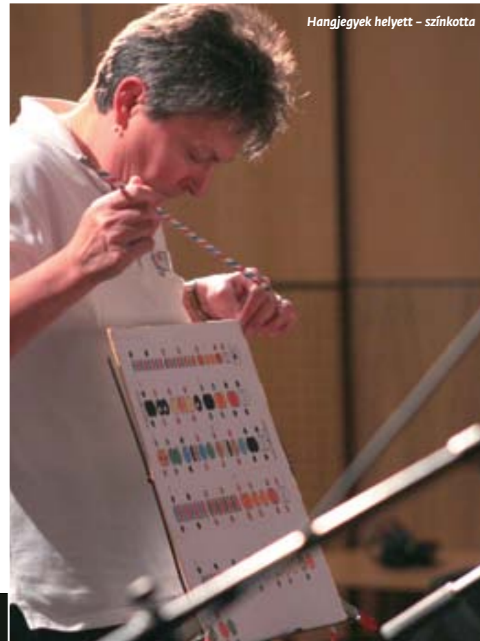
Hangjegyek helyett – színek