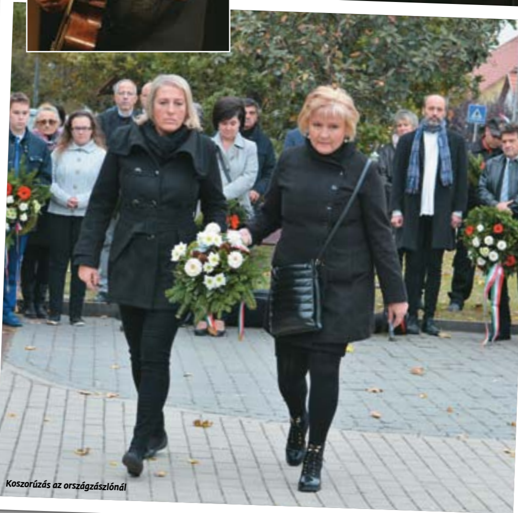
Koszorúzás az országzászlónál