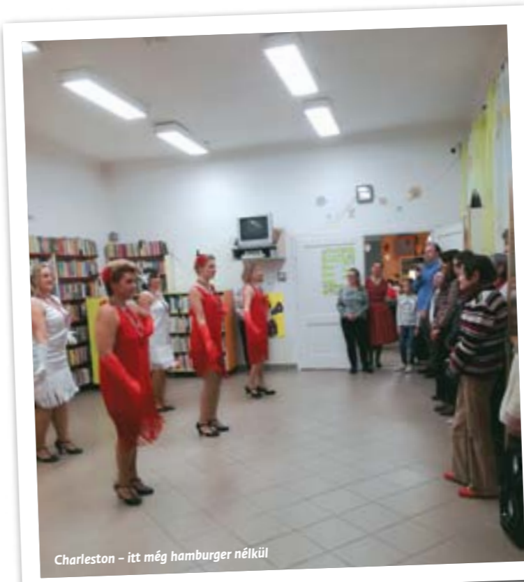
Charleston – itt még hamburger nélkül

Hogyan és miért került egyszerre mindez a könyvtárba?