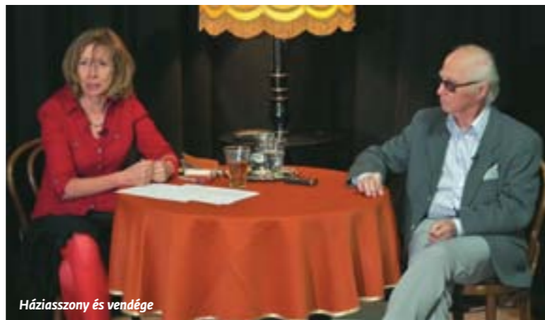
Háziasszony és vendége

Remélem, új kezdeményezésünk is sikert arat. A diskurzusok bensőséges hangulatúak, kérdező, válaszadó és a helyszín most is biatorbágyi, sőt az interjúkat a városi tévé is rögzíti és sugározza.