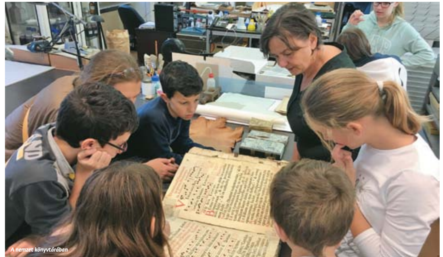
A nemzet könyvtárában