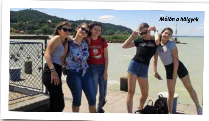
Mólón a hölgyek

A karantén miatti bezártságban sokszor szomorkodtunk azon, miért mi vagyunk ilyen pechesek, hogy hetekig nem találkozhatunk egymással, elmarad az osztálykirándulásunk, és még nem is ballaghatunk. Aztán minden jóra fordult, hiszen ballaghattunk, és egy napra lementünk az osztállyal a Balatonra.