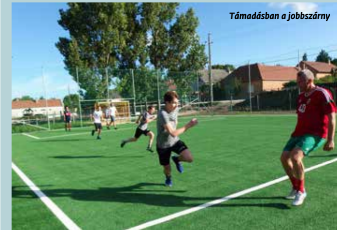
Támadásban a jobbszárny