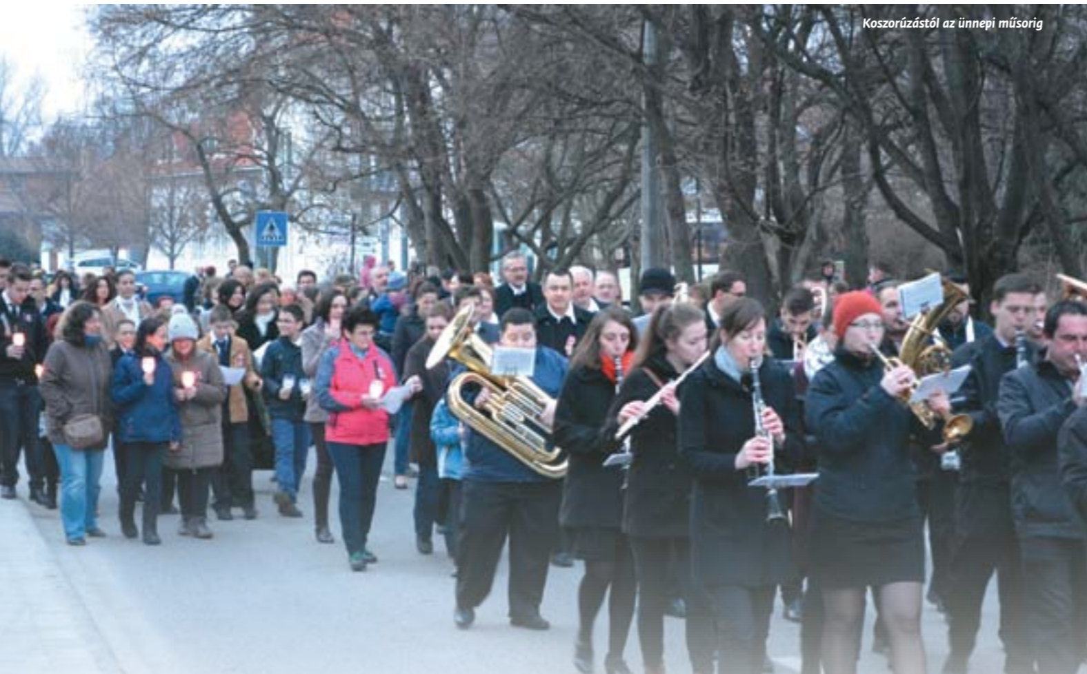
Koszorúzástól az ünnepi műsorig