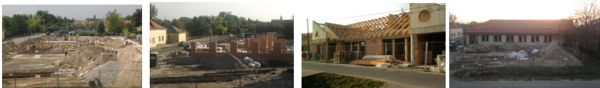
Az építkezés képei 2011-2012. évben.

Ebből a rövid elemzésből is kitűnik, hogy a városban a bölcsődei ellátás iránti igény nagy. Mivel a településen eddig nem működött bölcsőde, a gyermekek felvételét nagyon körültekintően, megfontoltan kell elbírálni a rászorultság, veszélyeztetettség tükrében. Mindezt csak egy olyan team tudja megtenni, akik a családokkal kapcsolatban vannak. Gondolok itt a védőnőkre, és a gyermekvédelemben dolgozó kollegákra.