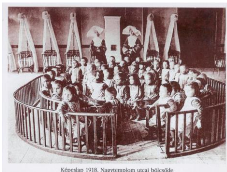
Képeslap 1918. Nagytemplom utcai bölcsőde

„Szeresd a gyermeket a lét fénye Ő Esteledik hogyha megy, Hajnalodik hogyha jó.” / Móra Ferenc”