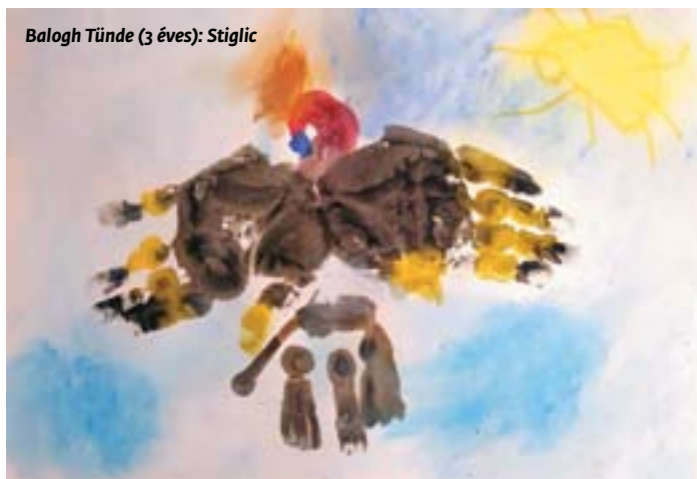
Balogh Tünde (3 éves): Stiglic