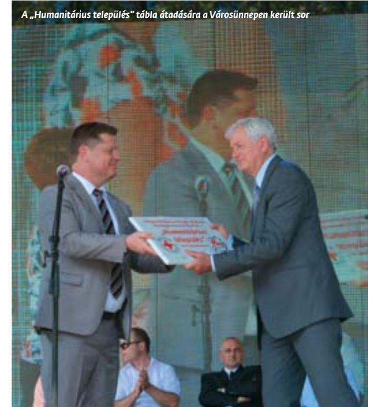
A „Humanitárius település” tábla átadására a Városünnepen került sor