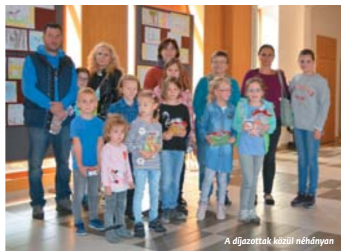
A díjazottak közül néhányan