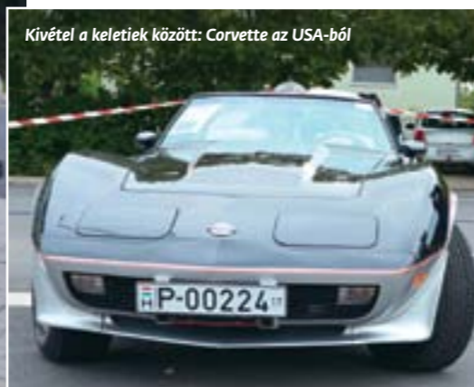
Kivétel a keletiek között: Corvette az USA-ból