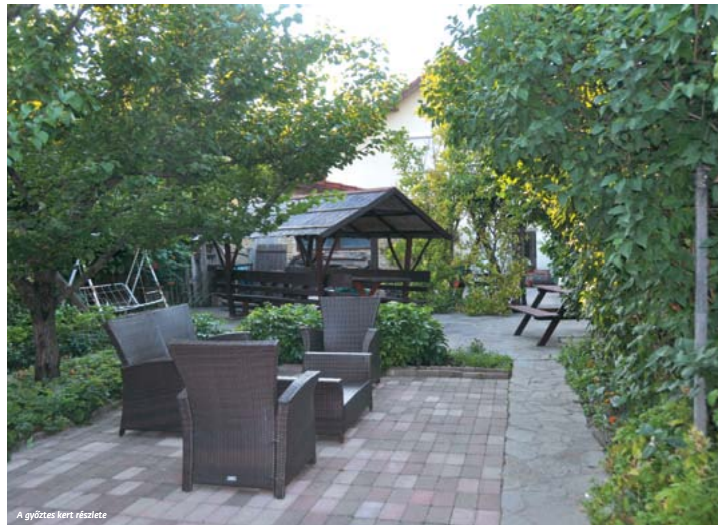
A győztes kert részlete