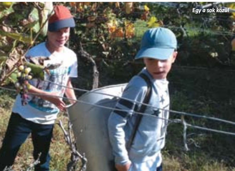
Egy a sok közül