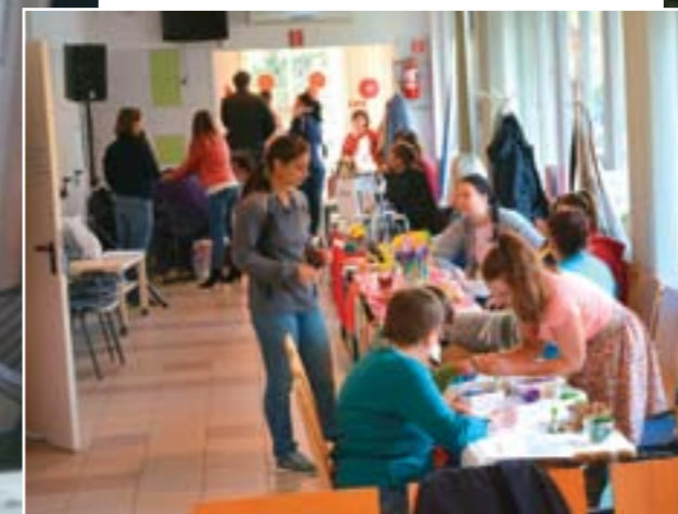
Cseppben az igazság