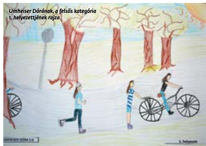
Umheiser Dórána, a felsős kategória 1. helyezettjének rajza

A városi egészségnap egyik hagyományos mozzanata, amikor a szervezők kihirdetik a gyermekrajzpályázat eredményét, a díjazottak pedig büszkén átveszik az elismerés tárgyasult „ereklyéit”. A Nyár – egészség – egészségedre címmel meghirdetett rajzverseny értékelési szempontjai a következők voltak: család, egészség, közös program, természet, mozgás, kompozíció, színek.