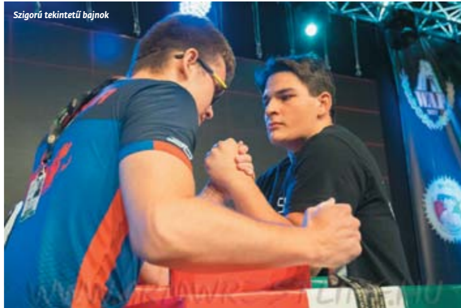
Szigorú tekintetű bajnok

A többiekéről: Zsófi nem volt ott fejen, amikor asztalhoz állt. Lehet, zavarta a huszonnyolc méteres színpad, a fények vagy a kamerák, de nem tudott koncentrálni, ezért nem is volt sikeres. Levike ballal mondhatni ügyes volt: tizennégy indulóból nyolcadik lett, és egy hellyel megelőzte az Eb-bronzérmes török versenyzőt. Volt gyors nyert meccse és küzdős vesztese is. Egyiknél sem az erőhiány volt a veszteség, inkább a lassú indítás. Ha csak az erő döntene, akkor dobogón állna, de ez szkanter,