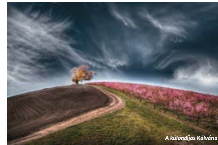
A különdíjas Kálvária