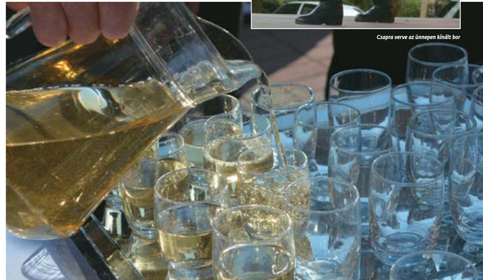
Csapra verve az ünnepen kínált bor