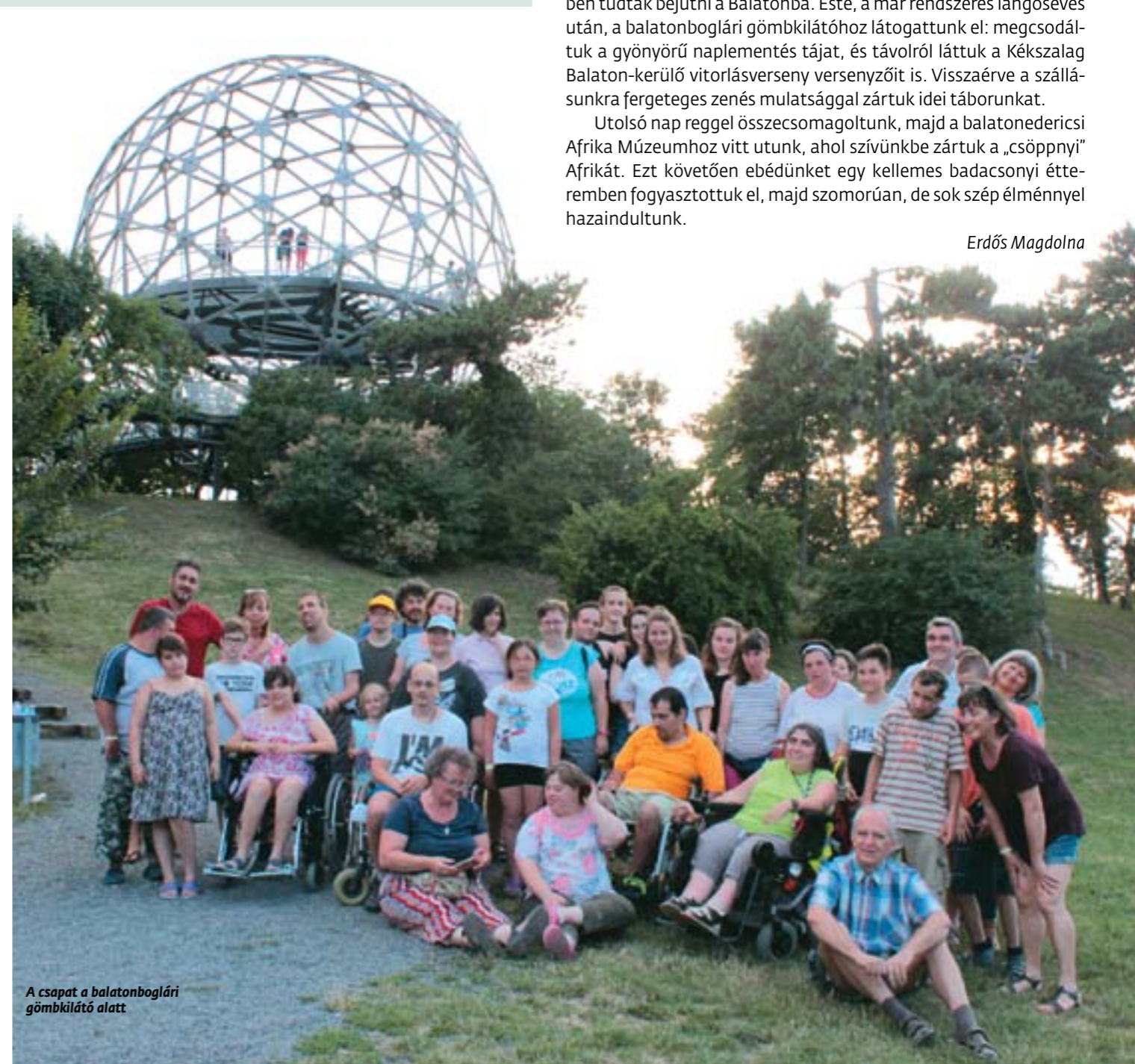
A csapat a balatonboglári gömbkilátó alatt