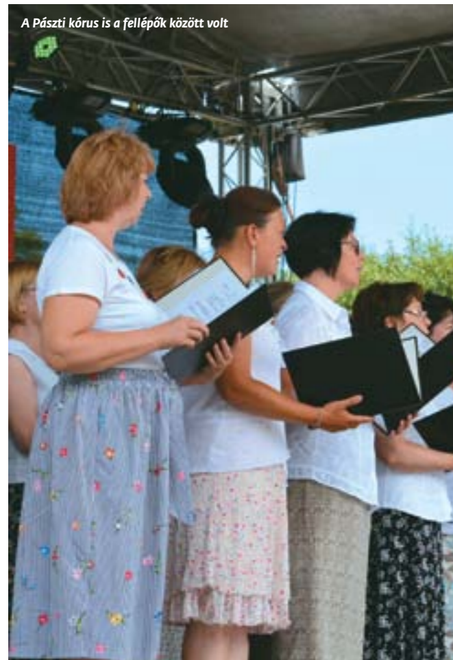
A Pászti kórus is a fellépők között volt