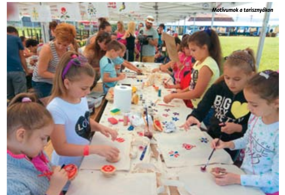
Motívumok a tarisznyákon