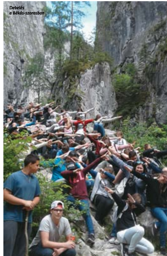
Debelés a Békás-szorosban