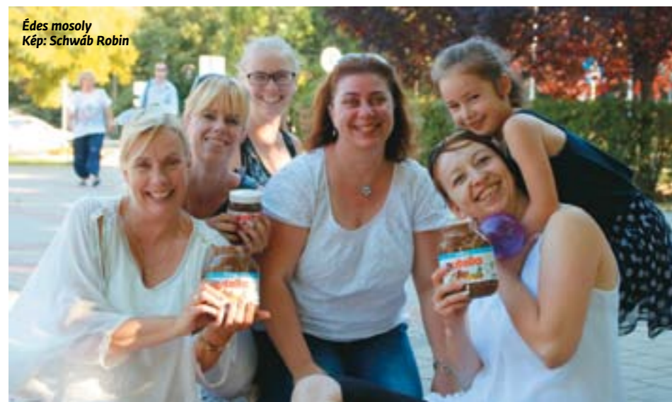
Édes mosoly