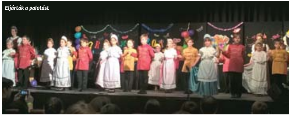
Eljárták a palotást

Az elsők az Állatok vitája címmel egy zenés-táncos színdarabot mutattak be, a másodikok pedig az erdőben történt különös esetről számoltak be Doktor Bubó közreműködésével. A harmadik osztály Sün Balázs történetét mesélte el nekünk, és egy vidám, színes, angol nyelvű kórus is alakult belőlük a színpadon. Iskolánkban újabb negyedik osztály készül átlépni a felső tagozat küszöbét. Ők idén is az immár hagyománnyá vált palotás táncdal nyitották, és vastaps kíséretében zárták is a műsort. Felső tagozatos diákjaink Molnár Ferenc A Pál utcai fiúk című regényéből Rácz tanár úr órájára röptettek el bennünket,