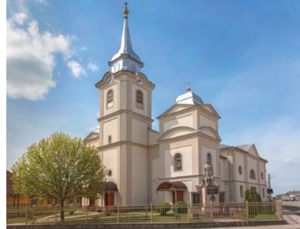
Nagydobronyi reformátusok temploma

akinek nem futja. Biatorbágygal azonos hullámhosszon vagyunk; nagyon jó az anyagi segítség, de ami még ennél is többet jelent, az az emberi kapcsolatok erőssége.