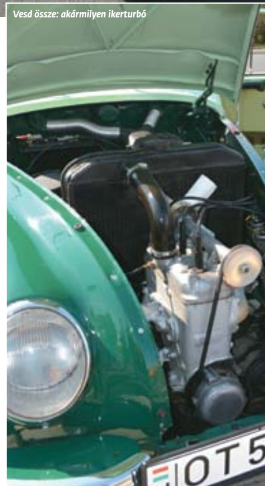
Vesd össze: akármilyen ikerturbó