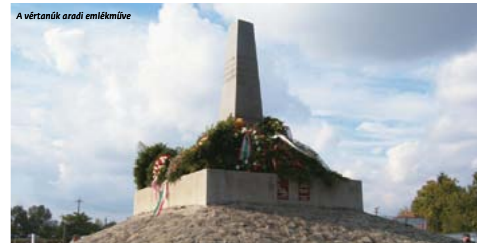
A vértanúk aradi emlékműve