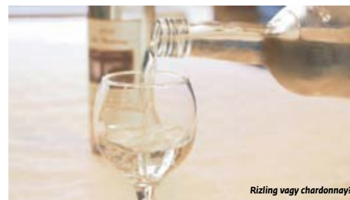
Rizling vagy chardonnay?

A rendezvényt igyekeztünk különlegessé tenni azzal, hogy vendégborászokat is meghívtunk, és egy közös kóstolóesten ismerkedtünk boraikkal és a borvidékükkel. A paletta nagyon színesnek bizonyult, hiszen vendégünk volt az Espák-pincészet