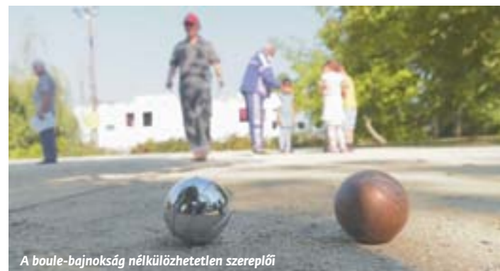
A boule-bajnokság nélkülözhetetlen szereplői

Épphogy elkezdődött a tanév, máris színes programsorozat várta diákjainkat. A tanulók nagy lelkesedéssel készültek a hétfőre tervezett boule-bajnokságra, amelyet az időjárás miatt csak szeptember 7-én, szerdán tudtunk megtartani. Az öröm azonban nem maradt el. A Turwaller Stammtisch Egyesület tagjainak szakszerű játékvezetésével minden osztályban bajnokokat avattunk.