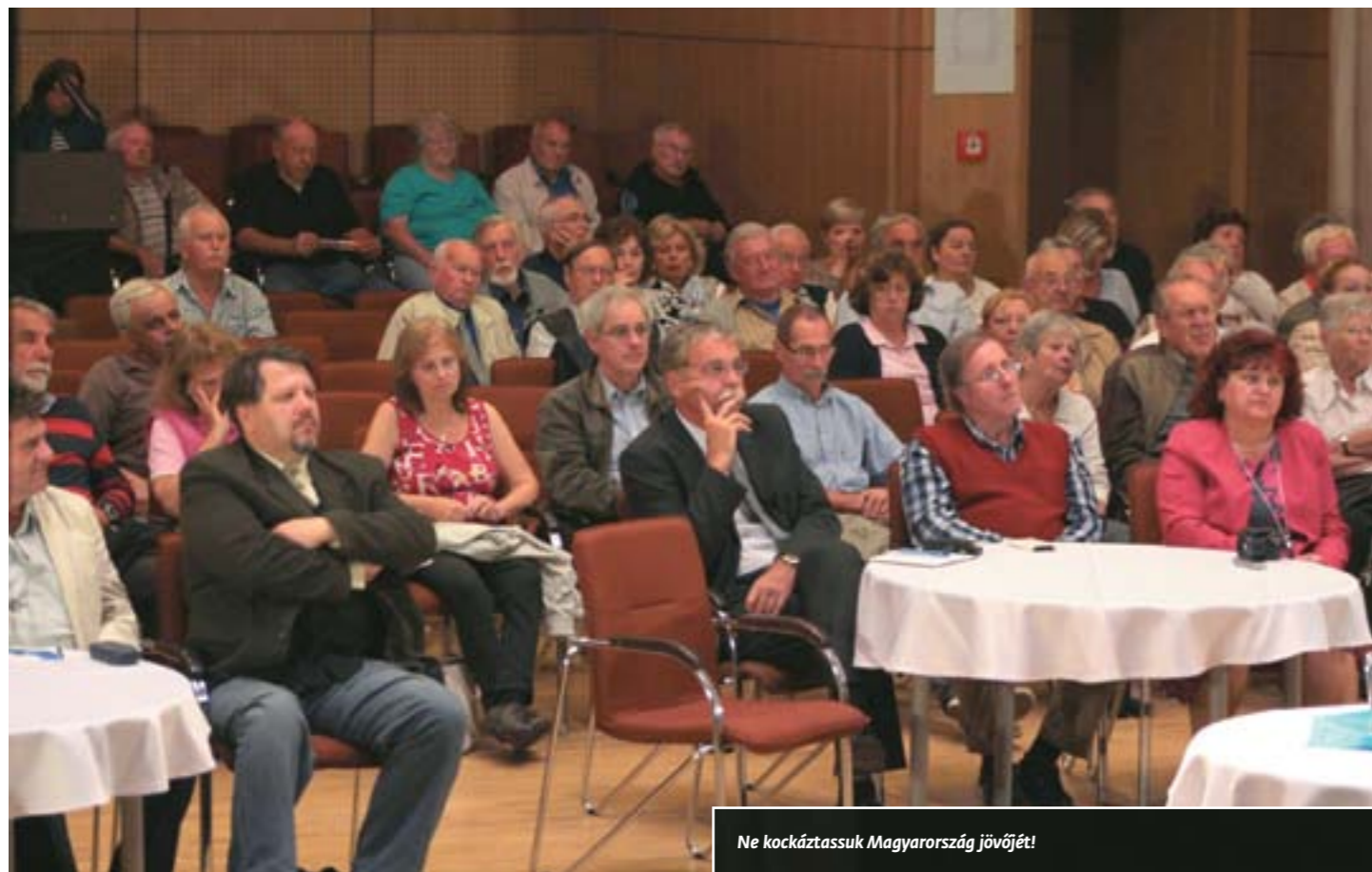
Ne kockáztassuk Magyarországnak jövőjét!