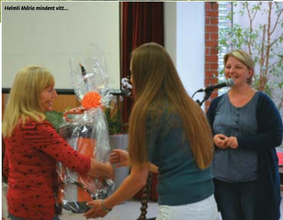
Helmi Mária mindent vitt...