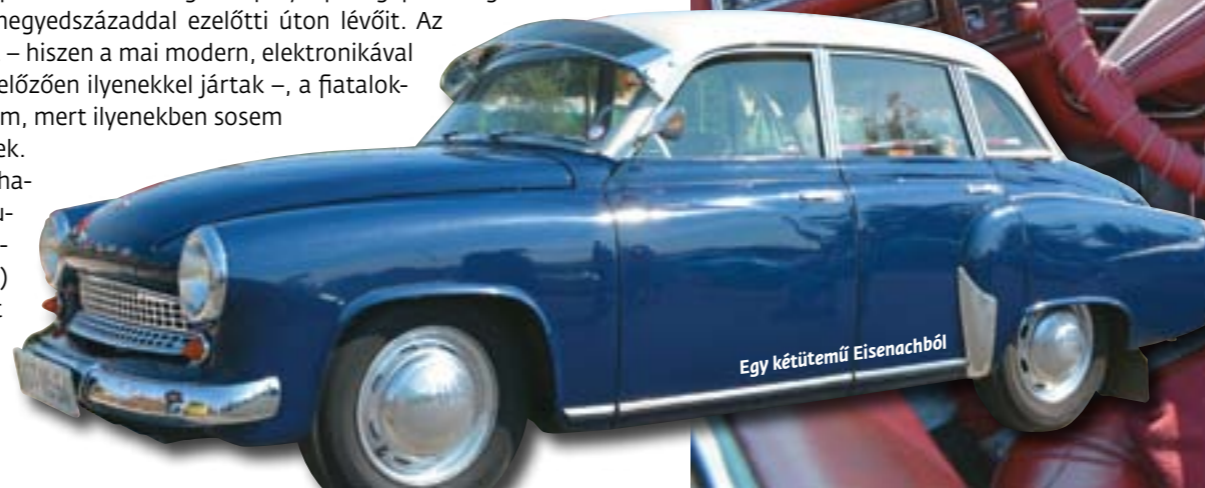
Egy kétütemű Eisenachból

Tulajdonképpen meghatározó, hogy veteránautó-tulajdonosok milyen szeretettel mutatják meg (be) gépeiket – erre is volt példa a rendezvényen –, nem beszélve a folyamatos karbantar-