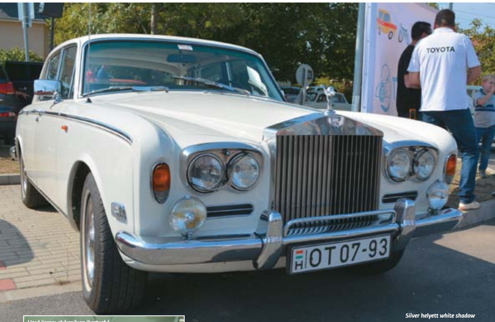
Silver helyett white shadow