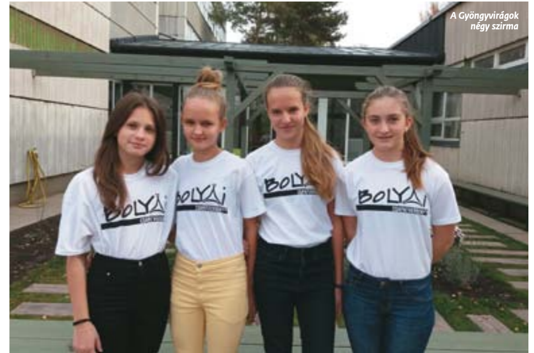
A Gyöngyvirágok négy szirma