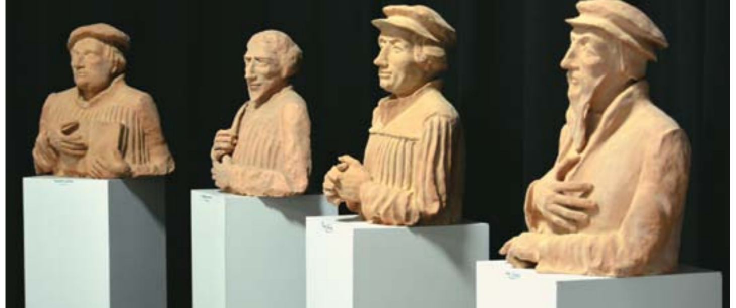
Reformátorok, balról az első Luther Márton mellszobra