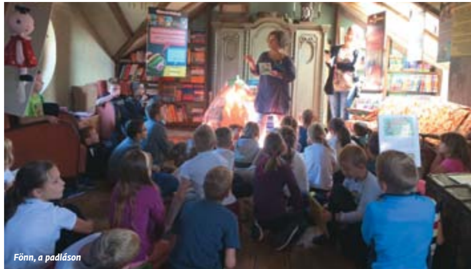
Fönn, a padlásán

A csodákból mi magunk is részesülhetünk, mégpedig egy igencsak sikeres kiállítás kapcsán, örömmel látva, hogy Bálint Ágnes könyveinek szereplői a 21. század otthonában éppúgy családtagok, mint több évtizeddel ezelőtt. Szeptemberben csak Biatorbágyról több mint húsz óvodai, iskolai csoport látogatott a Móra Könyvkiadó által rendezett életmű-kiállításra a Kisgombos Padlására, így a foglalkozások alkalmával közel ötszáz gyermek, míg egyénileg több tucat érdeklődő, nosztalgizáló felnőtt csodálta meg a színes tablót, a szerző írógépét, Mazsola tökházikóját, a faliszekrényből elővarázsolt iskolát, valamint Böbe baba, Frakk és a macskák