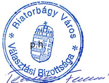
Temesvári Ferencné HVB Elnöke