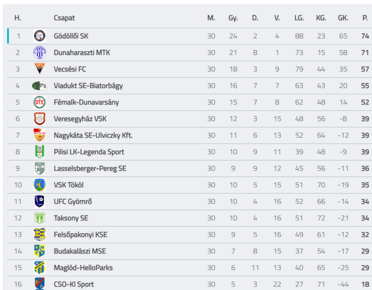
Tabella 2021-22 idény

Felnőtt labdarúgó csapatunk a 2021-22 szezonban a 4. helyen végzett, mindössze 2 pontra lemaradva a dobogós helyezésről.