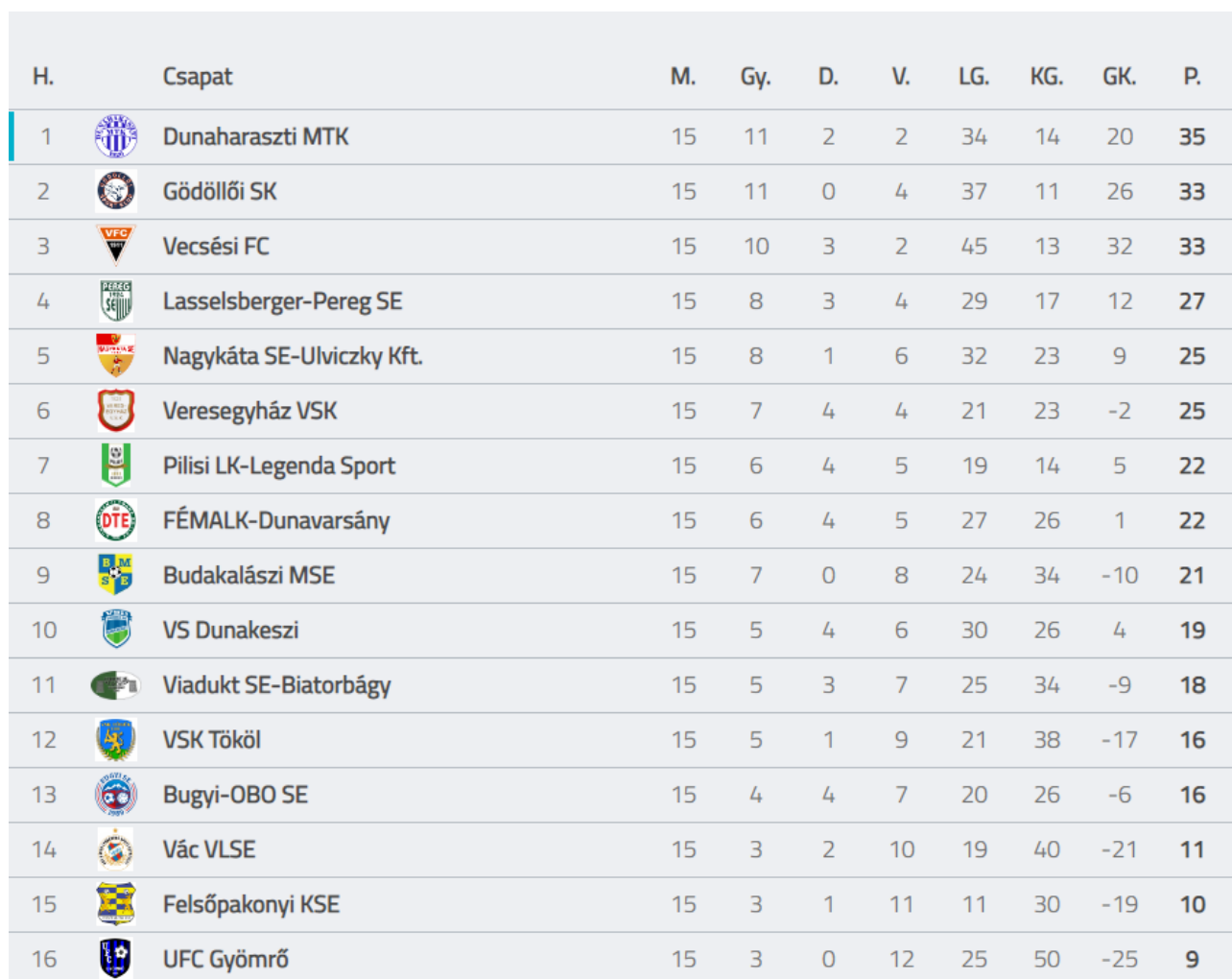
TABELLA 2022-23 őszi szezon

A gyengébb szereplés oka az edzőváltás, mely nem sikerült jól (a régi edző egyéb elfoglaltsága miatt nem tudta tovább vállalni a csapat vezetését) valamint meghatározó játékosok sérülései.