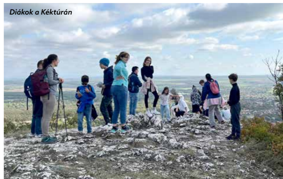
Diákok a Kéktúrán