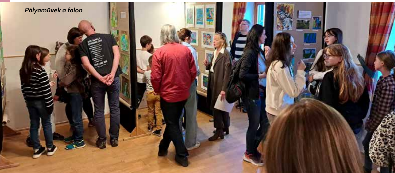
Pályaművek a falon