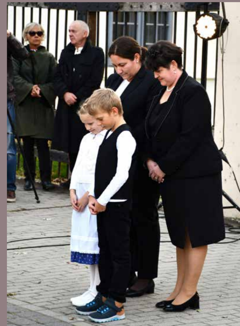
A polgármester köszönti '56 köztünk élő tanúit