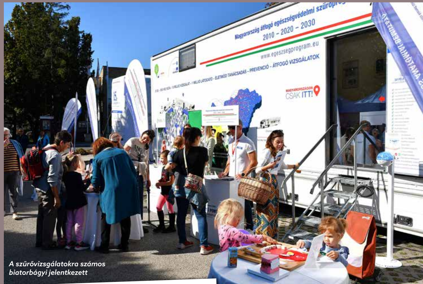
A szűrővizsgálatokra számos biatorbágyi jelentkező