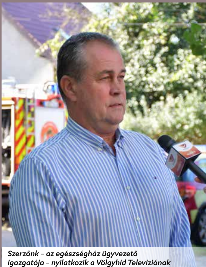
Szerzőnk - az egészségház ügyvezető igazgatója - nyilatkozik a Völgyhíd Televíziónak