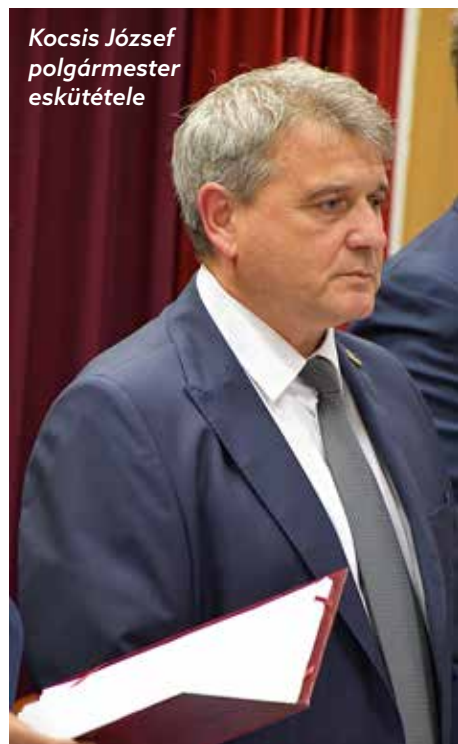
Kocsis József polgármester eskütétele