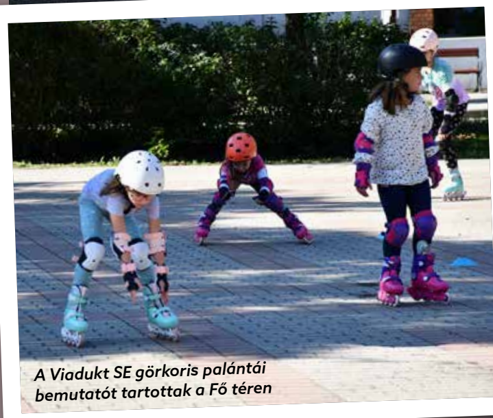
A Viadukt SE görkors palántái bemutatót tartottak a Fő téren