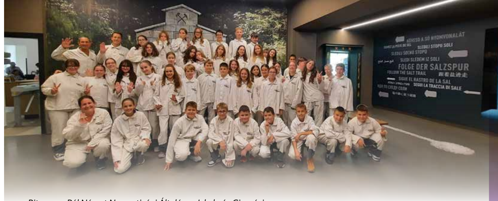
Ritsmann Pál Német Nemzetiségi Általános Iskola és Gimnázium