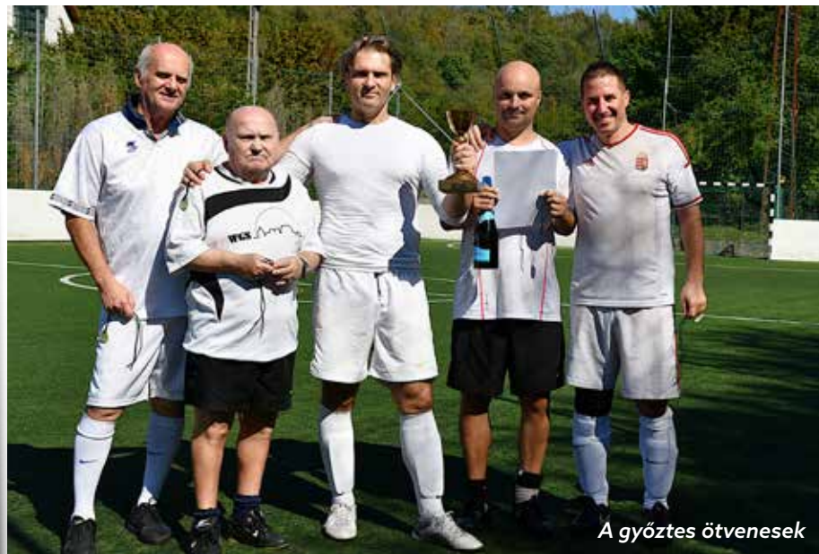
A győztes ötvenesk