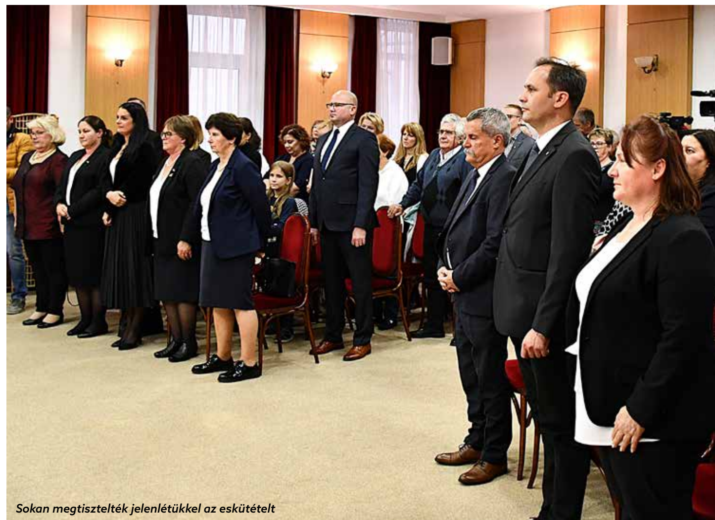
Sokan megtisztelték jelenlétükkel az eskütételt