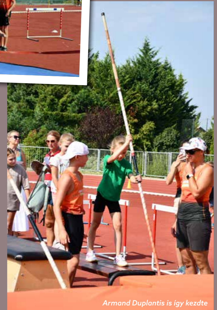
Armand Duplantis is így kezdte