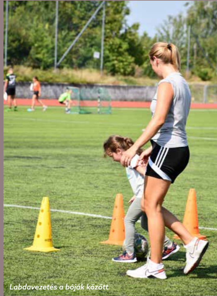
Labdavezetés a bóják között