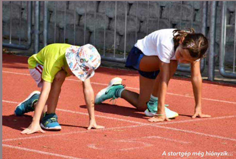
A startgép még hiányzik...