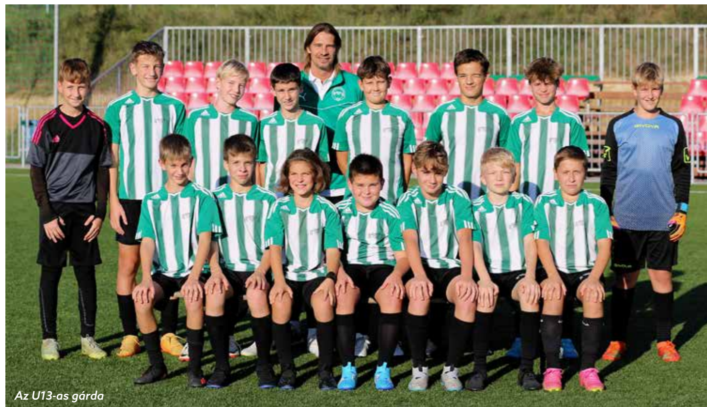
Az U13-as gárda