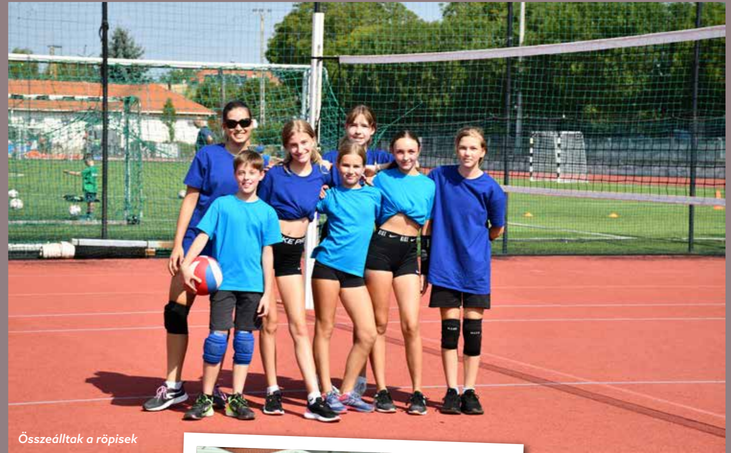
Összeálltak a röpisek