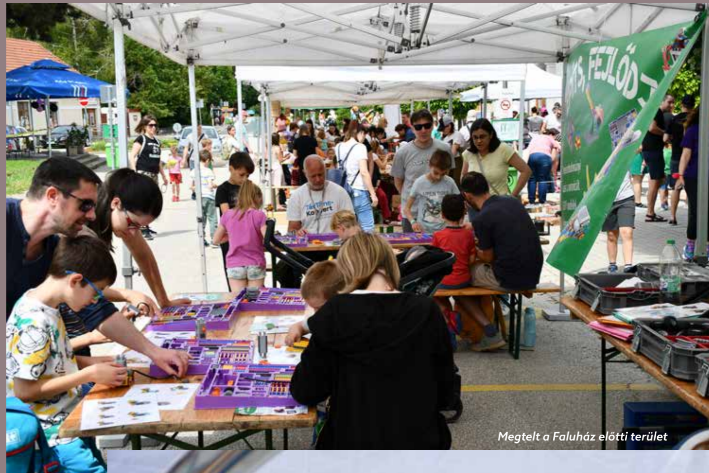
Megtelt a Faluház előtti terület