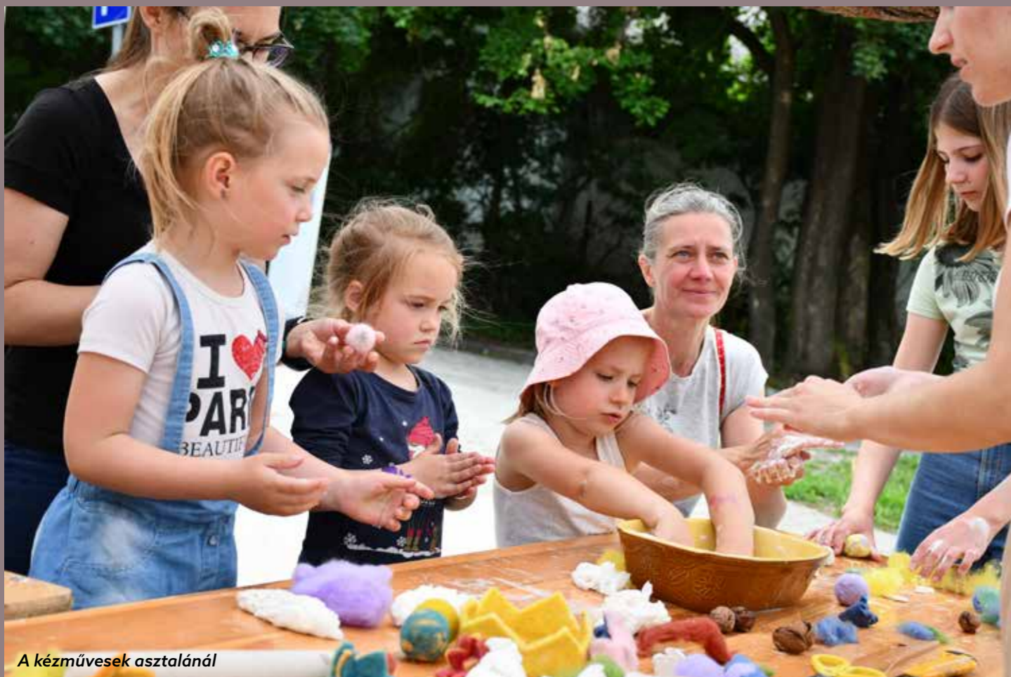
A kézművesek asztalánál