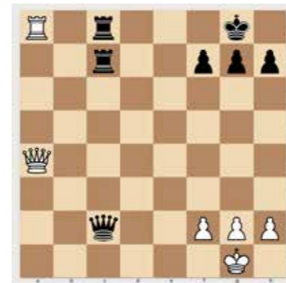
Világos lép, és két lépésben védhetetlen mattot ad. 1 pont

Az Olvasósarok utódjaként jelentkező Családi Körben című rovat egyik újdonsága, hogy havonta sakkfeladvánnyal bővül, és aktualitásokkal, színes hírekkel, sakk történelmi visszatekintésekkel, anekdotákkal szeretnénk népszerűsíteni a játékot. Kedvcsinálóként létraversenyt indítunk, amelynek során jutalompontokért egyszerűbb állásokban a legjobb lépéseket kell megtalálni. A megszerzett pontokat összeadjuk, a nyár elején amatőr és versenyző kategóriában eredményt hirdetünk, és a legjobbakat a Viadukt SE sakkszakosztálya díjazza. – A szerk.