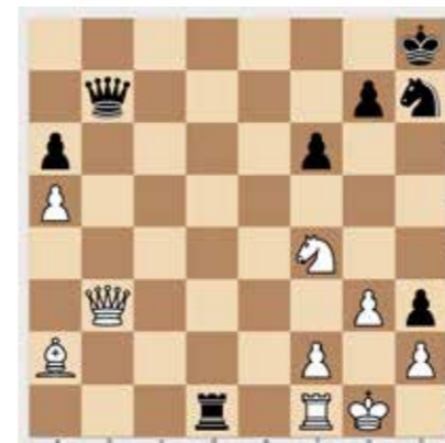
Sötét lép, és két lépésben védhetetlen mattot ad. 2 pont