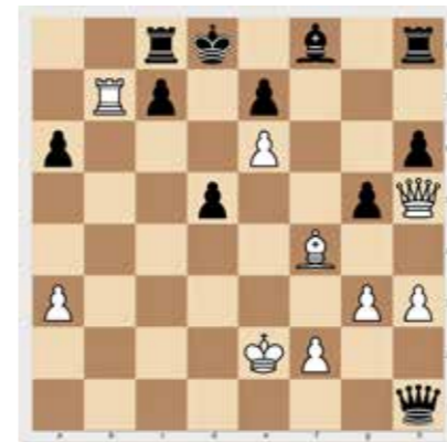
Világos lép, és három lépésben védhetetlen mattot ad. 3 pont