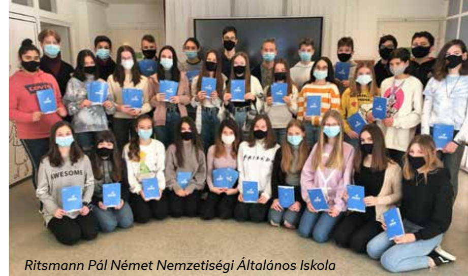
Ritsmann Pál Német Nemzetiségi Általános Iskola