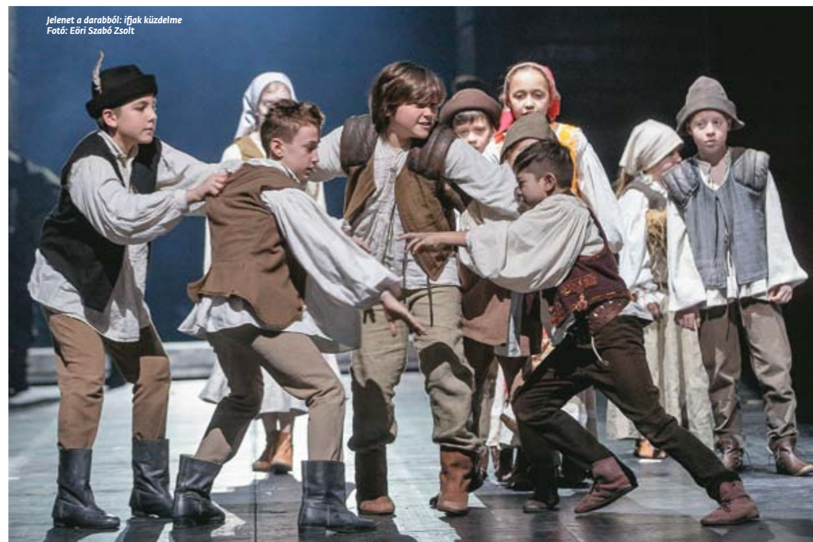
Jelenet a darabból: ifjak küzdelme