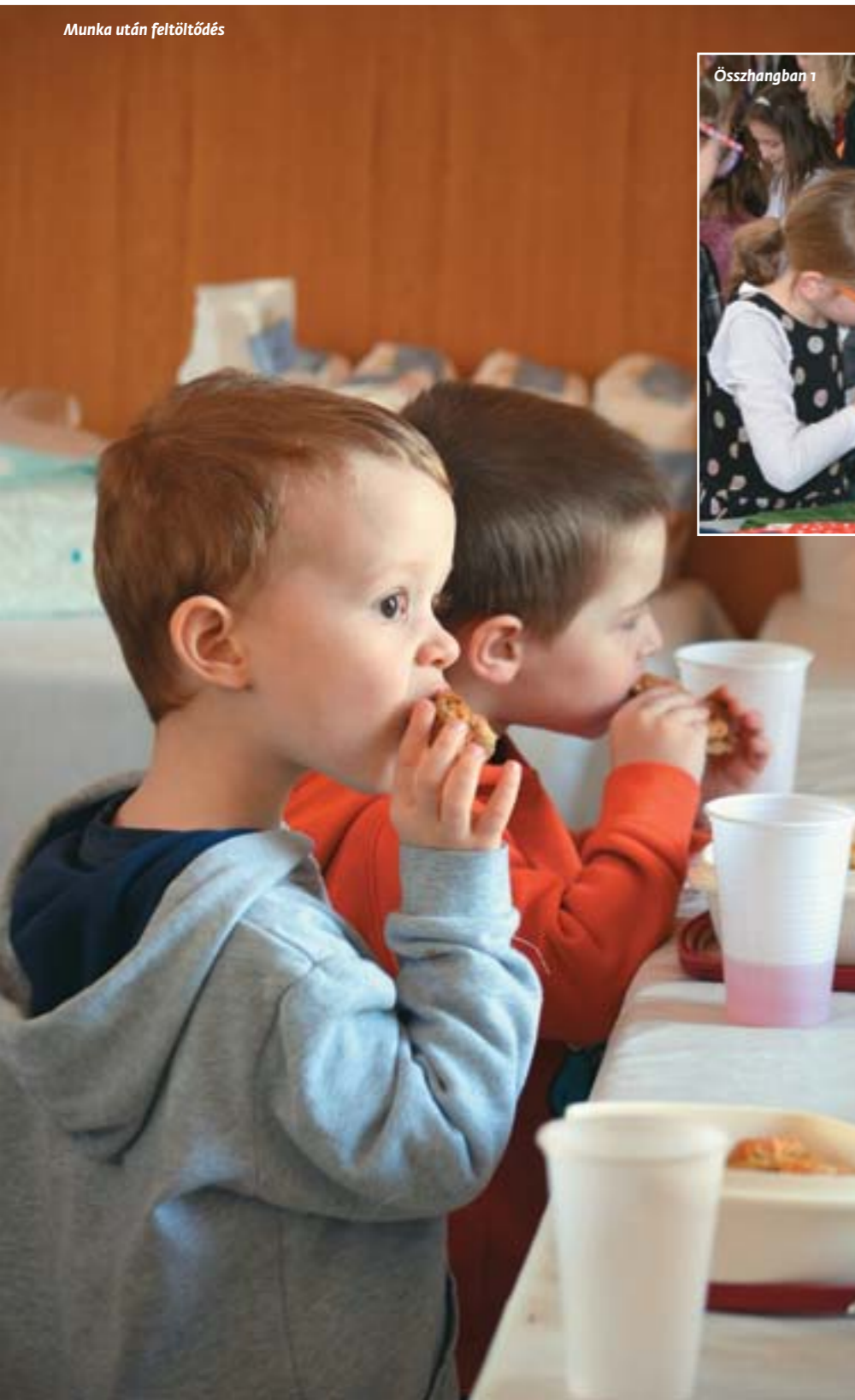
Munka után feltöltődés

Hát itt a husvét, alleluja! És ilyenkor öntözködni szokás, S az ezüstbokás Verőfény táncol az emberek szívében, S a tavaszi veréb dudolász a fákon, Mint valami kis szárnyas furulya, S a télkabátot zálogba vágom, S randevúra hívom az ideáлом – És a többi, satöbbi, satöbbi, Amit már nem szokás Senkinek az orrára kötni.