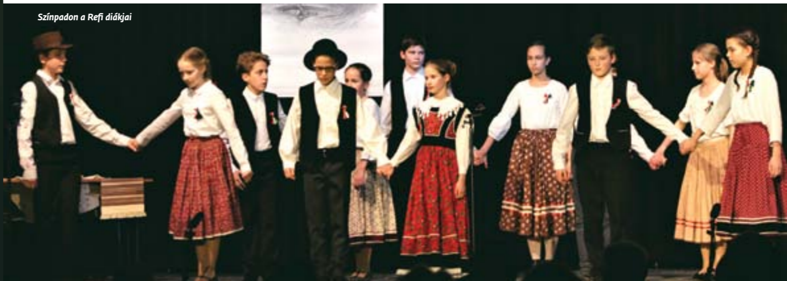
Színpadon a Refi diákjai