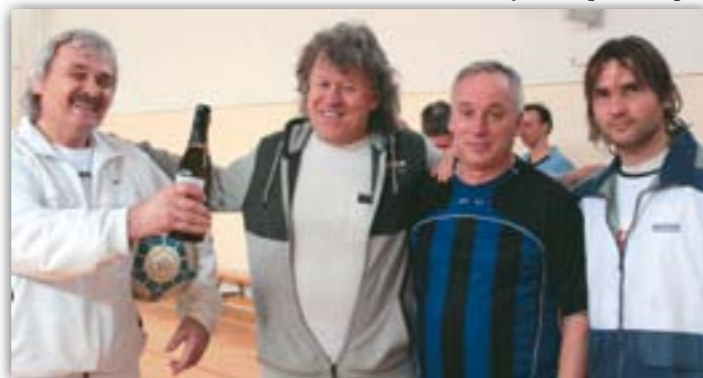
A torna második helyezett csapata, a Kispest